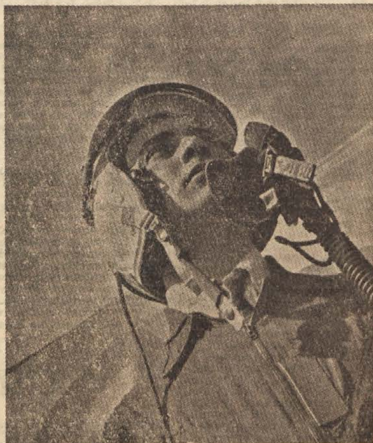
Se bliža sovražnik?