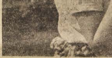
V filmu »Kopli pod brezo« igra glavno žensko vlogo, Lenčko, Mira Sardočeva

Zelev je morda na prvi pogled res skromna. Vse republike so posele 42 umetniških filmov, nad 400 dokumentarnih, okoli 500 tednikov, okoli 300 raznih drugih kratkih filmov, nad 100 poučnih in šolskih filmov. Deset let življenja je kratka doba. Italijanski film se je iskal petdeset let; prav toliko cela vrsta filmov vodilnih dežel. Mehiški se je porajal dvajset let, pri tem pa je imel dolgoletno hollywoodsko tra-