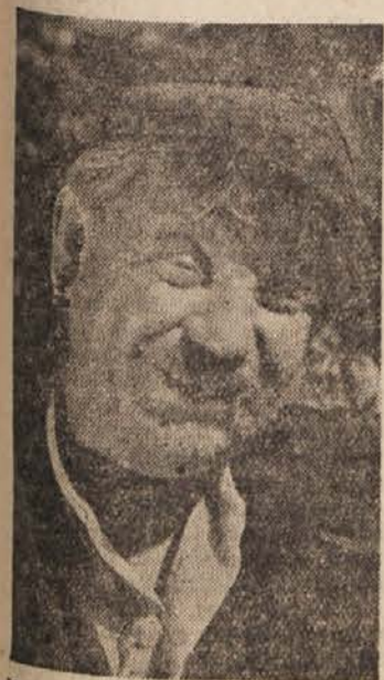
Našega prijubljenega igralca Staneta Severja spričo odlične maske komedij prepoznamo v njegovi najnovejši filmski vlogi Andreja Vitužnika

Naj za uvod tudi sam uporabim filmski stil... Leto 1954. V provincialni družni nadobudnega srednjeevropskega naroda so pretrgali ozračje ugodni klic: