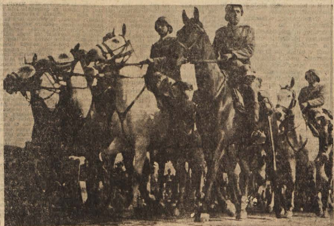
Konjenica na pohodu

daj skupščina potrditi ne ustreja potrebam Francije.« Načel je tudi vprašanje, »kaj bo zadržalo ponovno oboroženo in združeno Nemčijo od izločitve iz zahodnega bloka?«