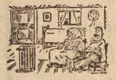
»Žena, s tole pečico so naju osleparili. Saj vidiš, da sploh ne greje.«

4. dobava posode: Posoda prispje po suhem v pristanišče določene dne, ki naj bo po možnosti čim bližje dnevni odhoda podmornice. Istočasno bo