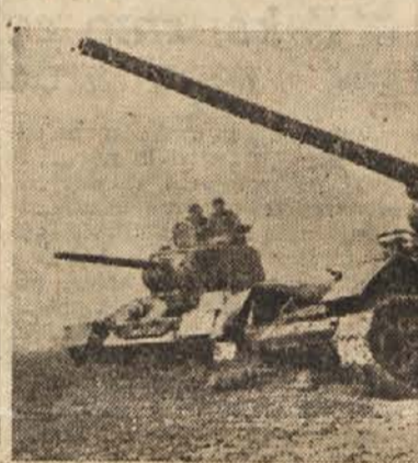
Tanki na pohodu

bi bil tako značilen za življenje in delo vse enote polkovnika Arsenića.