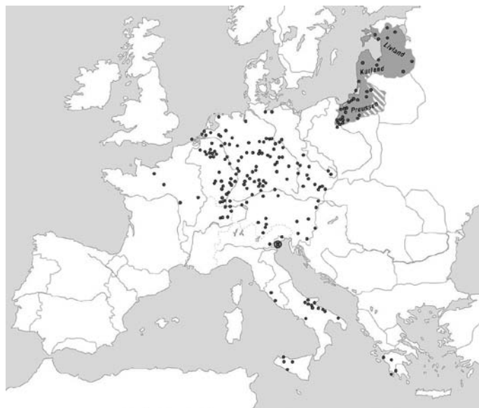
Komende nemškega viteškega reda okrog 1300

Upravna struktura reda se je postopoma razvila v 13. stoletju in je bila pogojena z intenzivnim pridobivanjem zemljiške posesti in drugih privilegijev. 6 Na čelu reda je bil s strani generalnega kapitlja izvoljeni veliki mojster, ki je imel do 1291 sedež v Akkonu. Velikemu mojstru so bili konec 13. stoletja vsaj v formalnem smislu podrejeni trije deželni mojstri ( dr. Landmeister ) – deželni mojster v Livoniji, deželni mojster v Prusiji in deželni mojster v nemškem cesarstvu, imenovan tudi nemški mojster ( dr. Deutschmeister ). Deželnemu mojstru v Prusiji in Livoniji so bile posamezne komende podrejene neposredno, medtem ko so bile komende, ki so bile v njegovi