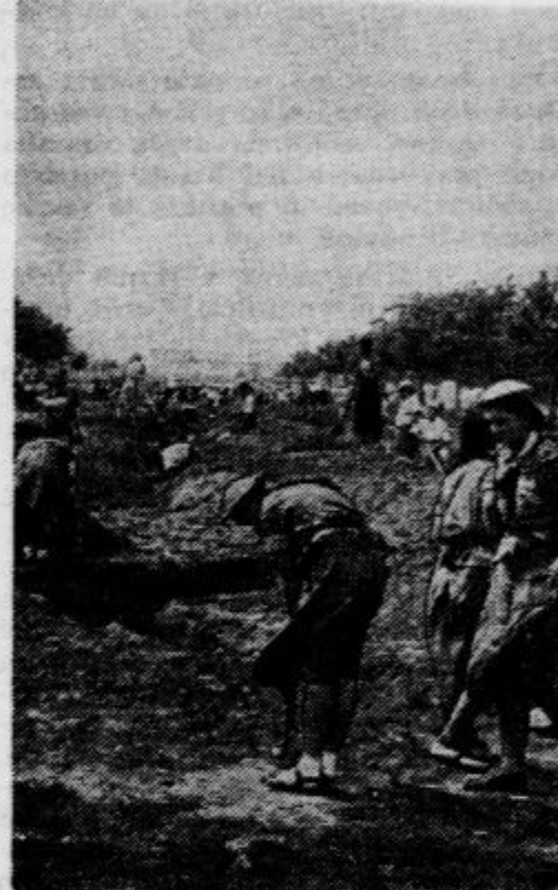
V Varšavi sodeluje pri obrambi mesta vse prebivalstvo. Še pred dnevi so mlade študentke pomagale kopati jarke