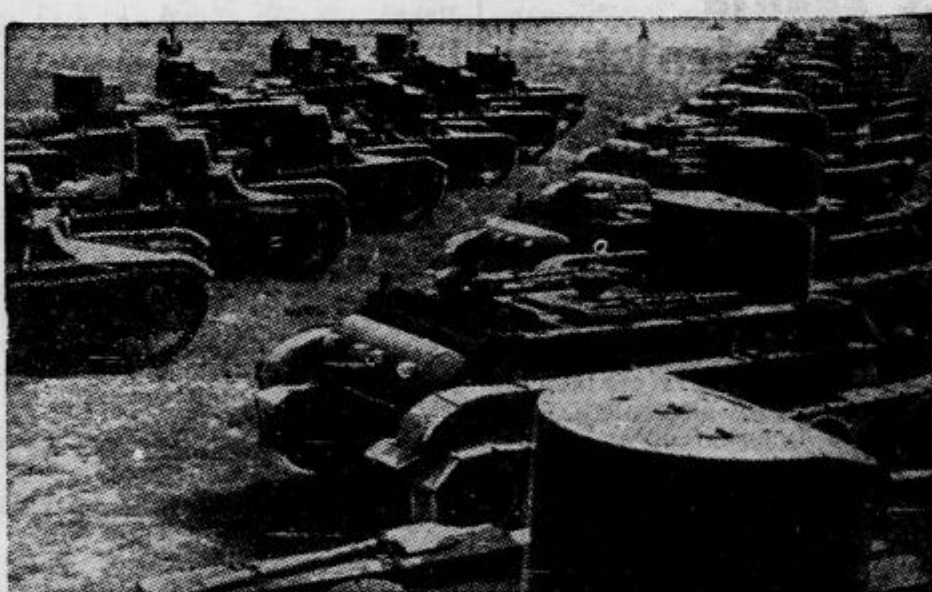
Ruska pehota je vkorakala na Poljsko pod zaščito lahkih tankov, ki so jih po dovršenem pohodu razvrstili kakor kaže pričujoča slika