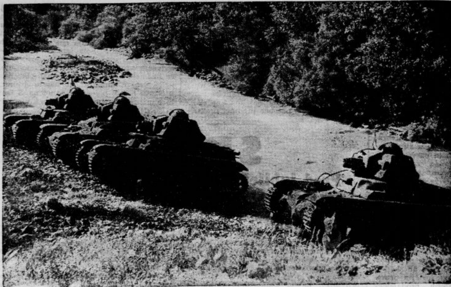
Francoski tanki na zapadnem bojišču