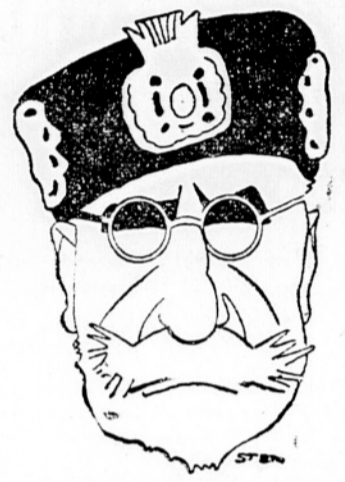
Tuniški bej Mohamed Al Amin

Zapadno nemška ekonomska agencija VWD sporoča, da bo od 21. do 23. januarja 1953 v Hamburgu mednarodni žitni kongres, na katerem se bodo sestali mednarodni strokovnjaki za žito. 23. januarja pa bo mednarodni borzni seštatek na hamburški borzi.