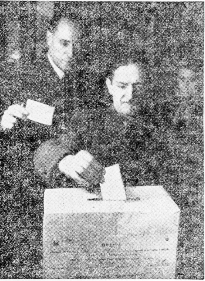
Delavce in delovni inteligent glasujeta za lepšo bodočnost delovnega človeka

Tako pomemben poskus, da bi dosegli demokratično bistvo enotnosti oblasti, je mogoče samo v državi, v kateri pripada delovnemu ljudstvu vsa oblast in kjer jo le-ta že izvaja po svojih zastopnikih, in ljudskih odborih in Ljudskih skupščinah, v delavskih svetih in drugih samoupravnih organih, ter po raznih oblikah neposrednega upravljanja. Brez take podlage v družbeni in politični ureditvi bi bilo načelo enotnosti oblasti navadna formalnost.