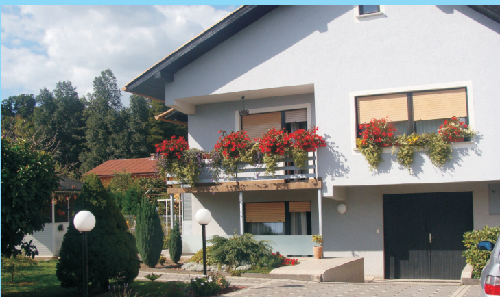
Milena in Konrad Zemljarič, Zabovci 100/a