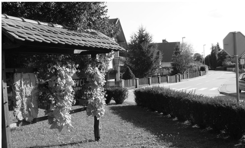
Najlepše urejeni del vasi - pri Špicu v Markovcih