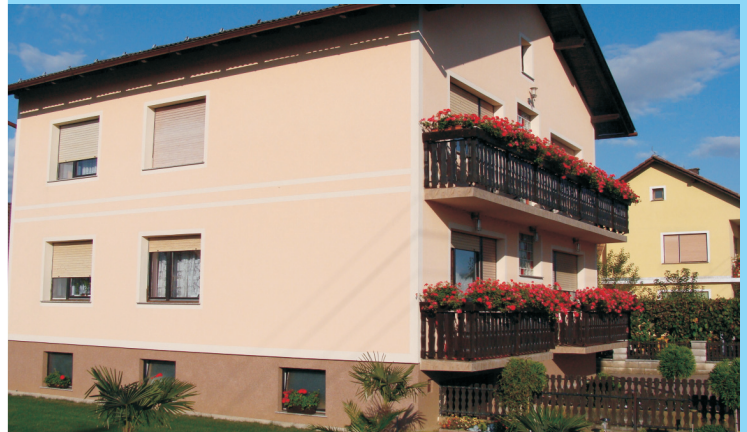
Družina Pilinger, Bukovci 7