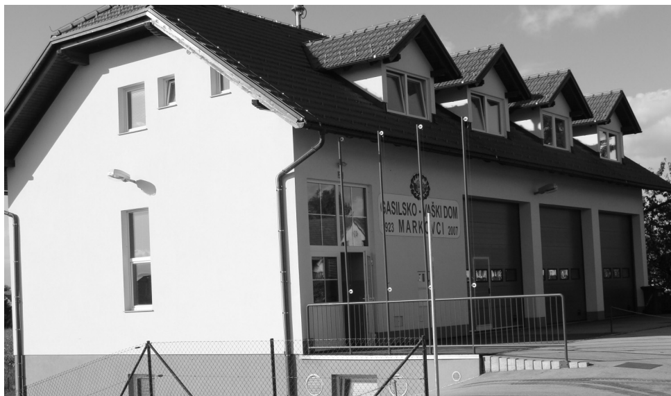
Najlepši vaški objekt - gasilsko-vaški dom Markovci