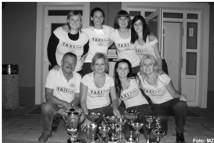
Ženska ekipa PGD Nova vas se je v Ligi 2009 uvrstila na skupno tretje mesto.