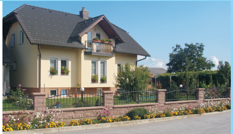
Družina Veselič, Borovci 15