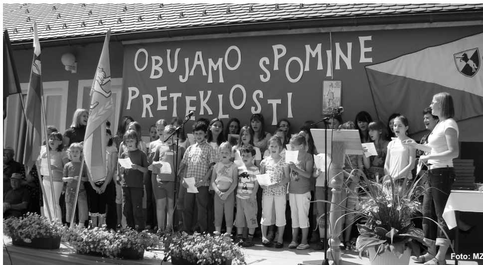
Pevke in pevci Otroškega cerkvenega zbora Alabare iz župnije Svetega Ilja iz Šentilja pod Turjakom so zapeli tudi na spomladanski prireditvi v Novi vasi.