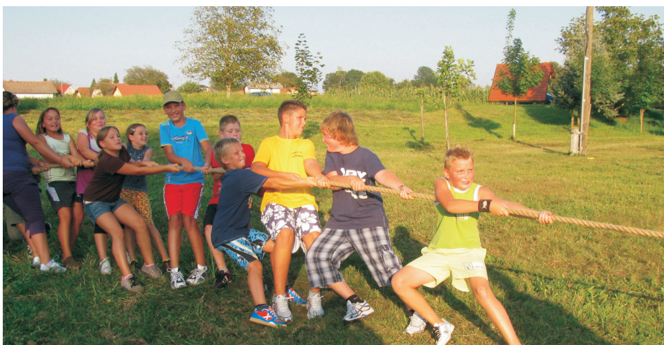
Tudi družabnih iger ni manjkalo na taboru. Še posebej se je bilo treba potruditi pri vlečenju vrvi.