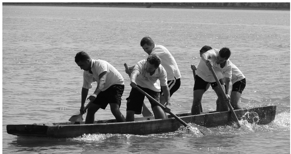
Zmagovalci druge Korantove rancarije - ekipa Gostišče pri Tonetu

Organizatorji so bili z izvedbo dogodka zadovoljni, saj se je prijavilo in tekmovalo več ekip kot lansko leto. Vroč sobotni popoldan pa je na obrežje ptujskega jezera pritegnil tudi številne navijače, ki so stiskali pesti in glasno navijali za svoje ekipe. V veslanju z lesenimi rancami je v moški konkurenci, tako kot lani, tudi letos slavila ekipa Gostišče pri Tonetu, druga je bila ekipa Razjarniki iz Zabovcev, tretja pa ekipa Športnega društva Spuhlja. Med ženskami je slavila ekipa Runda Bar, druge so bile Žabice in tretje Reglače. Omenjene ekipe so prejele pokale in denarne nagrade, za tekmovalce, oziroma za vse ekipe, pa so organizatorji pripravili tudi priznanja za sodelovanje, spominske majice in ma-