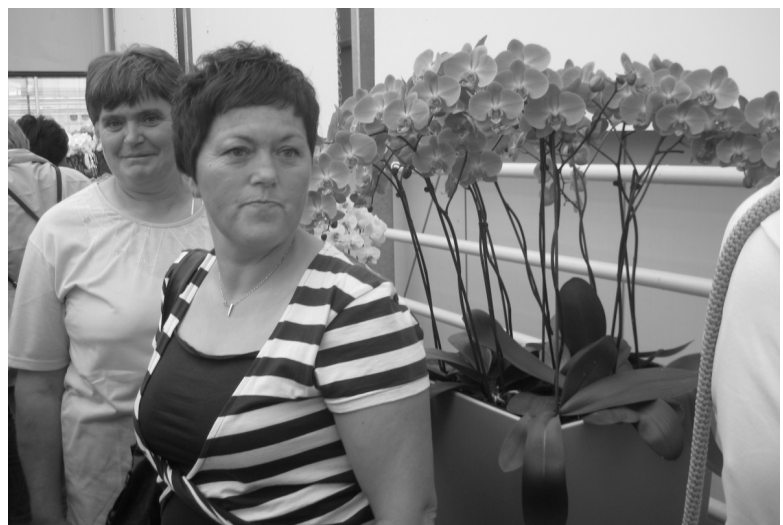
Med orhidejami v Dobrovniku