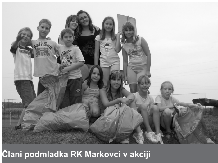
Člani podmladka RK Markovci v akciji

in je ne potrebuje, da jo prinese v prostore župnijske Karitas, ker ljudje trenutno povprašujejo po le-teh.