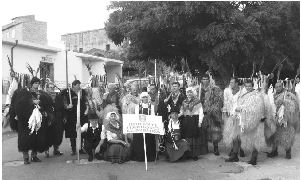
Markovčani na gostovanju na Sardiniji

Povorka po mestu je bila na dan sv. Janeza in se je začela na trgu sv. Janeza Batiste pred cerkvijo na dan njihovega