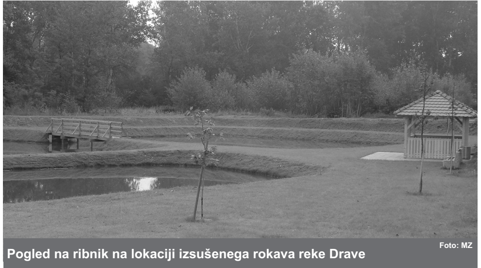
Pogled na ribnik na lokaciji izsušenega rokava reke Drave

Ribnik Zabovci leži tik ob levobrežnem potoku Rogoznica in na levem bregu Ptujskega jezera. Na zahodni strani ribnik posega do parcel, kjer so obstoječi infrastrukturni objekti Športnega društva Zabovci. Omenjeno društvo tudi skrbi za ribnik in njegovo okolico. Z realizacijo tega projekta je društvo dopolnilo svojo športnorekreacijsko po-