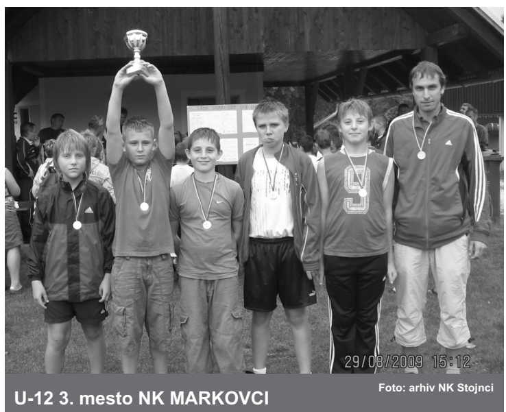
U-12 3. mesto NK MARKOVCI