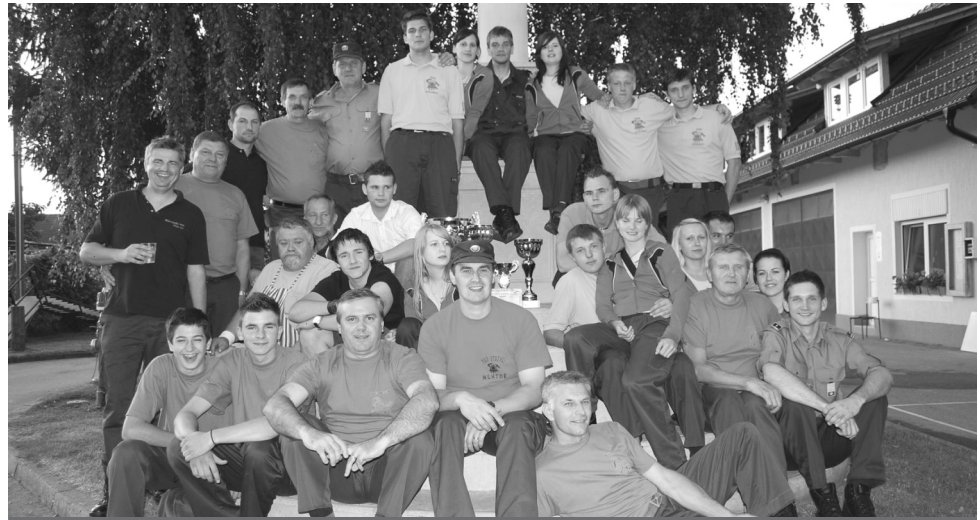
Člani in članice PGD Stojnci ter člani PGD Slovenja vas

Tekmovanje je potekalo v dveh tekmovalnih disciplinah, in sicer za člane in članice ter pionirje in pionirke. Člani in članice so se pomerili v vaji z motorno brizgalno (suha izvedba) ter v štafetnem teku, pionirji in pionirke pa v vaji z vedrovko in v prenosu vode. Tekmovalo je 23 ekip, pri članih so dosegli prvo mesto PGD Stojnci, drugo mesto PGD Gerečja vas, tretje mesto PGD Zlatoličje. Pri članicah je prvo mesto osvojila ekipa PGD Kebelj in drugo mesto PGD Stojnci. Pri pionirjih so prvo mesto osvojili pionirji PGD Bukovci, drugo mesto PGD Stojnci in tretje mesto PGD Draženci, pri pionirkah pa prvo mesto PGD Markovci in drugo PGD Zabovci. Člansko tekmovanje je bilo v Stojncih organizirano že več let zapovrstjo, nakar ni bilo več ekip in so se člani društva odločili, da organizirajo samo pionirsko tekmovanje. Letošnje leto smo se odločili, da skupaj organiziramo obe tekmo-