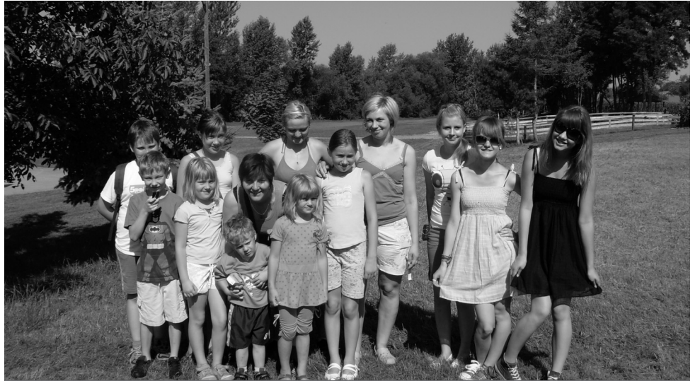
Tudi za družabni in sproščujoč popoldan si je treba vzeti čas!

Tako smo s pomočjo dekanijske Karitas pomagali nekaj staršem pri nakupu delavnih zvezkov in delno krili tudi stroške za nabavo drv. Škofijska Karitas nam je donirala najosnovnejše šolske potrebščine (različne zvezke, risalne bloke, svinčnike, radirke), tri nove šolske torbe, tudi nekaj zobnih past in zobne ščetke. Vse to smo razdelili staršem, ki so upravičeno potrebni vsaj nekaj pomoči, ko gredo otroci v šolo. Na voljo imamo še nekaj zvezkov, otroška in odrasla oblačila... Prosimo pa, če ima kdo doma posteljnino, morda kakšno koco