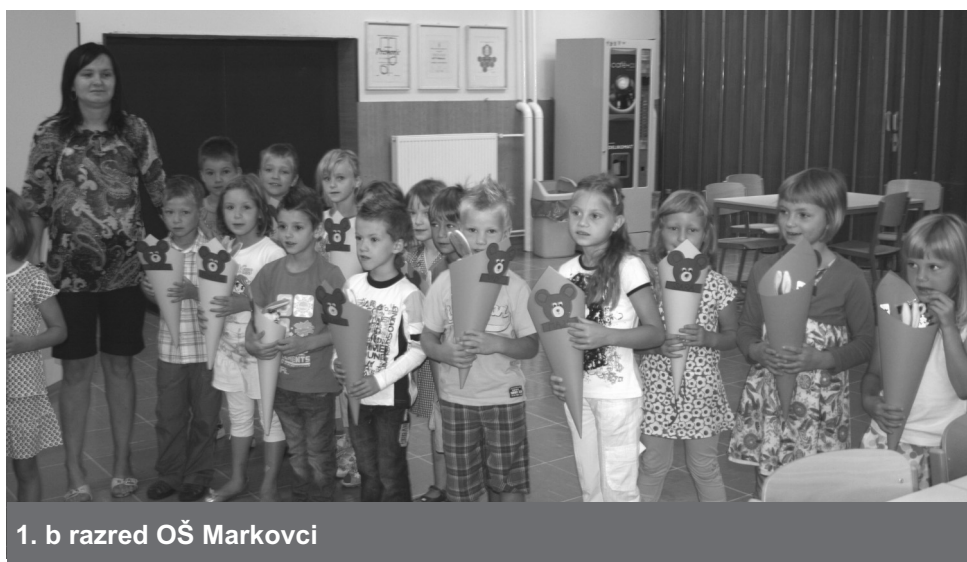
1. b razred OŠ Markovci

je kot igro, pri kateri mu bomo vsi stali ob strani.