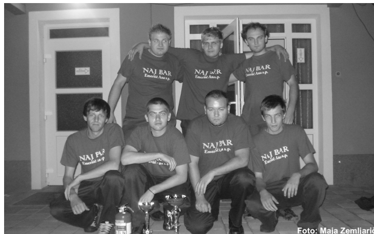
Moška desetina PGD Markovci je v Ligi 2009 osvojila skupno drugo mesto.