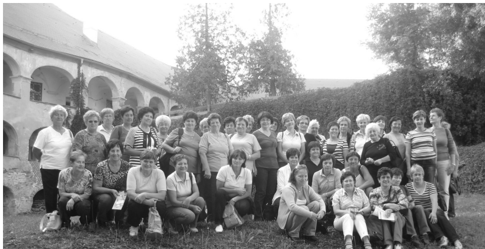
Udeleženske izleta po Prekmurju

V programu delovanja društva podeželskih žena občine Markovci je tudi izobraževanje članic na strokovnih ekskurzijah, kjer spoznavamo dopolnilne dejavnosti na kmetijah ter kulturne in druge zanimivosti.