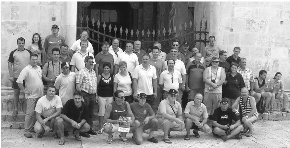
Gasilska slika za spomin na obisk pri gasilcih DVD Mladost iz Sučurca