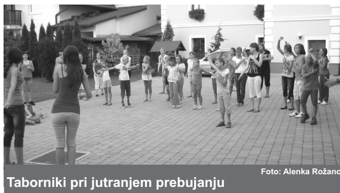
Taborniki pri jutranjem prebujanju