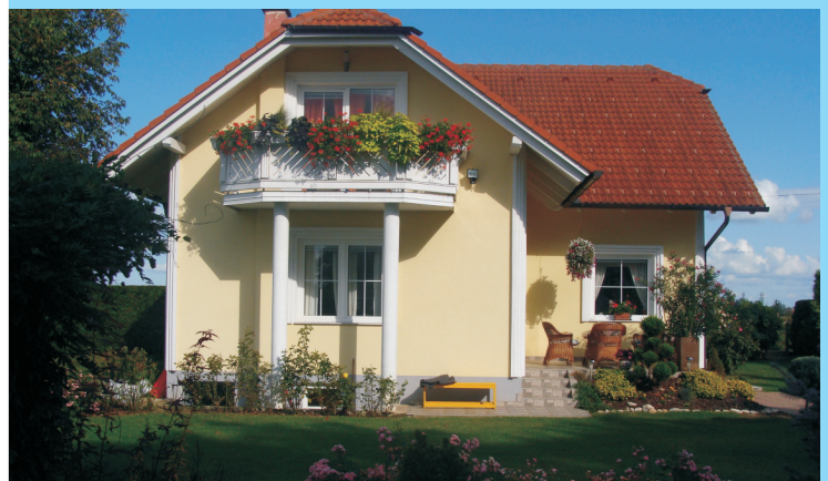
Družina Korošec, Strelci 1/a