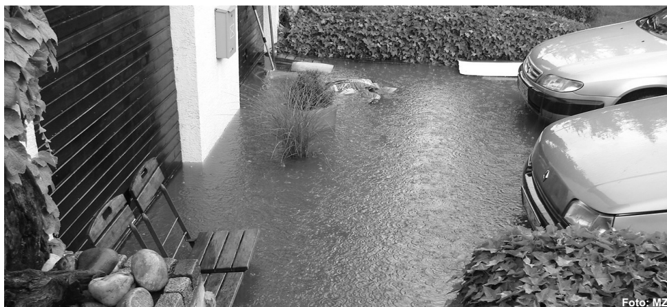
Poplave lahko povzročijo ogromno škode. Zato preventivno preverimo, ali smo se dovolj zaščitili pred morebitno nesrečo.