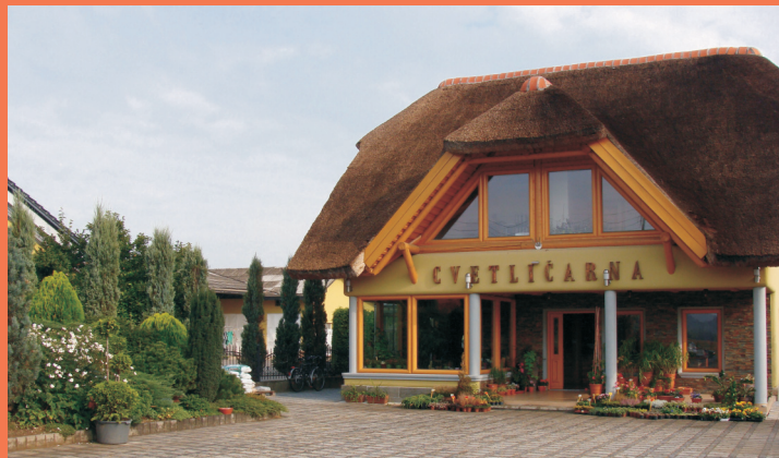
Najbolj urejen poslovni objekt: Cvetličarna Rožmarin Bukovci