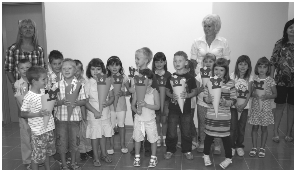
1. a razred OŠ Markovci

Vsem prvošolčkom naj se prvi šolski dan zapečati v srce kot poseben dan, ki se ga bodo z veseljem spomnili. Naloga staršev pa je, da skupaj s svojim otrokom raziščejo lepe stvari, ki jih bo prineslo učenje. Šola naj bo najlepši peskovnik, učitelji in starši pa otrokovi pomočniki pri gradnji peščenih gradov in utrd. Samo s pozitivnimi prisposobami lahko otroku pričaramo šolo in učen-