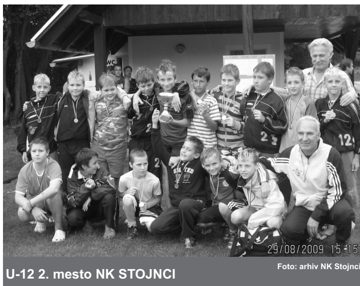
U-12 2. mesto NK STOJNCI