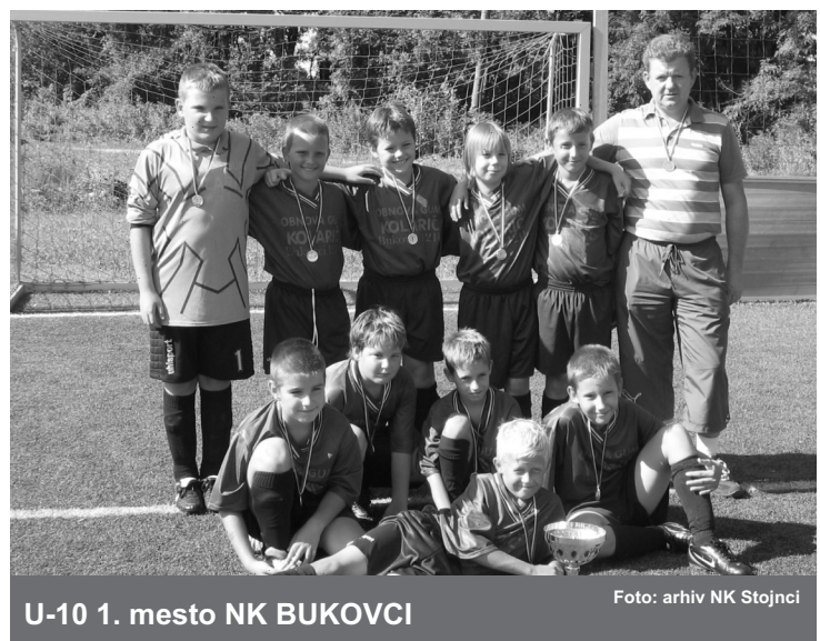
U-10 1. mesto NK BUKOVCI