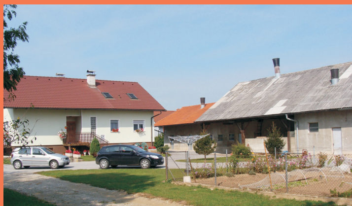
Naj kmetija v občini Markovci 2009 - kmetija Veršič iz Sobotincev