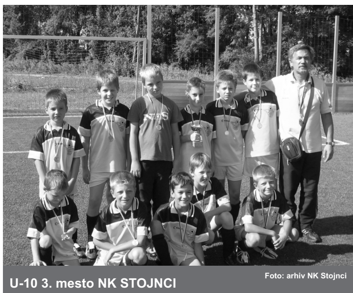
U-10 3. mesto NK STOJNCI