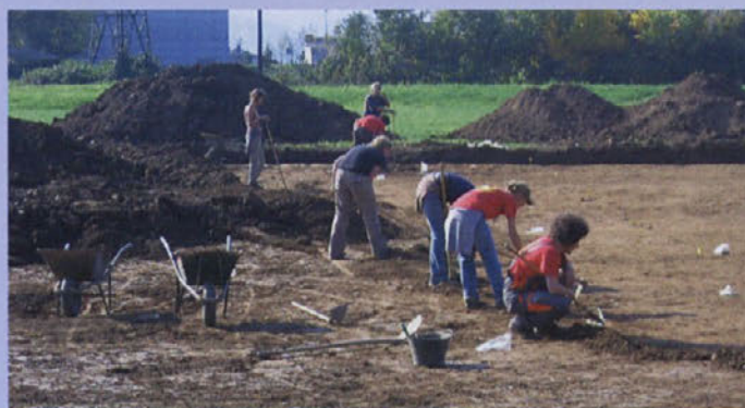
Izkopavanja bodo potekala še do konca novembra.

Z izkopavanjem so začeli 1. oktobra, končali pa bodo predvidoma do konca novembra. "Zaenkrat nismo našli nič posebnega. Našli smo predvsem odlomke keramike, keramičnih posod, značilne za bronasto dobo. Izkopali smo dva keramična svitka, na kakršnih so stale posode pri kuhanju. Našli smo tudi ostanke vertikalnih kolov, ki so držali strešne konstrukcije. Vse to kaže, da gre za ostanke skromne bronastodobne vasi. Smo pa z izkopavanji še bolj na začetku. Trenutno poteka strojno odstranjevanje vrhnje plasti in čiščenje spodnje. Kopljevo približno