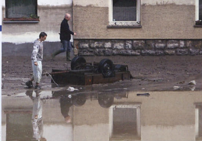
Železniki 18. septembra popoldne, ko je voda že precej upadla. Na hiši se vidi, do kod je segla voda.