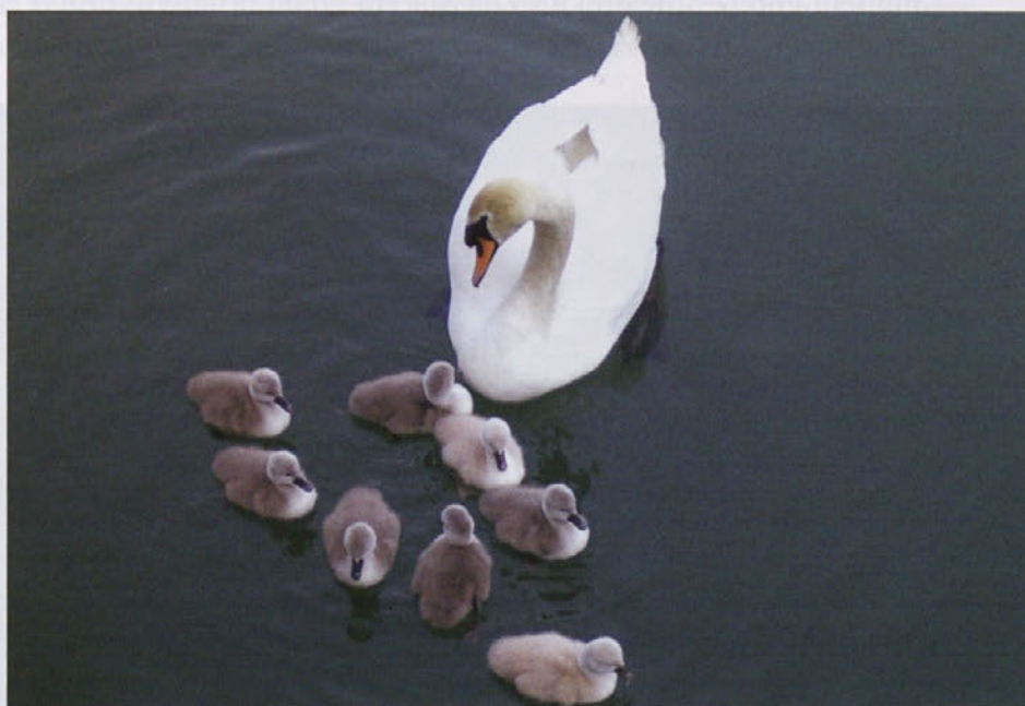
"Mama in otroci" na Zbiljskem jezeru