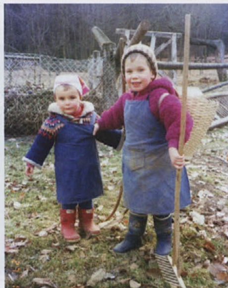
Bodoča gospodarja že od malih nog vajena dela