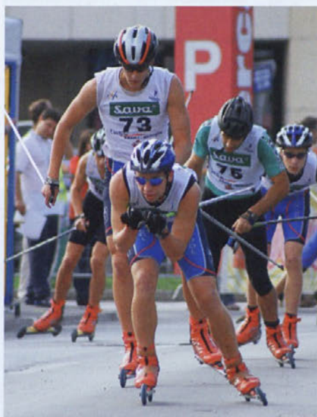
Tekmovali so tudi za pokal Slovenije na rolkah.

Medvode - V nedeljo, 16. septembra, je športno društvo ŠRC Preska-Medvode pred blagovnim centrom v Medvodah organiziralo Dan mladih in tekmo za pokal Slovenije v teku na tekaških rolkah. S programom za najmlajše so začeli že dopoldne in zanje pripravili animacijo s plesom, eko-delavnico, šolo rolanja, tik pred poldnevom pa jih je obiskal še čarodej. Pred njegovim prihodom so se otroci med seboj lahko pomerili na pravi slalomski tekmi z rolarkami, tistim nekoliko manj spretnim pa so pri prvih korakih pomagali učitelji. Bolj zares je šlo popoldne, ko se je ob dveh začela prva izmed tekem v hitrostnem rolanju. Tekmovanje so odprli osnovnošolci, ki so v po dveh kategorijah za dečke in deklice odpeljali tri kroge ali 1800 metrov. Za njimi so na trikilometrski progi nastopili rekreativci vseh starosti.