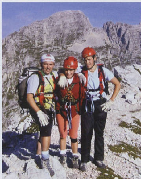
Misovi v popolni oprepi v slovenskih gorah