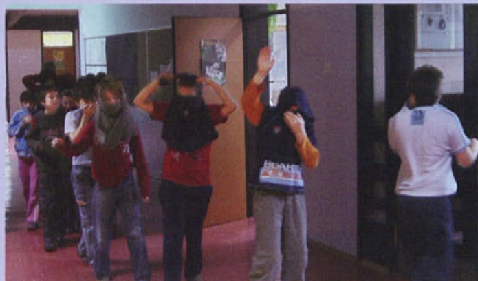
Učenci in zaposleni so šolo zapustili v dobri minuti.