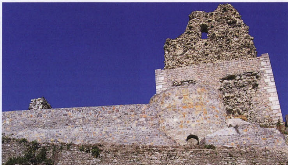
Smledniški Stari grad je z obnovo južnega obzidja dobil drugačno podobo.

Sredstva za obnovo gradu so namenjena iz občinskega proračuna, svoj del prispeva tudi TOD Smlednik. Vrednost letošnjih del je bila več kot 20 tisoč evrov. Poleg tega so prek razpisa Ministrstva za kulturo kandidirali za državna sredstva. Rezultati razpisa zaenkrat še niso znani. Glavni zalogaj jih čaka v prihodnjih letih, ko bo prišla na vrsto obnova grajskega razglednega stolpa. Obnavljati naj bi ga začeli