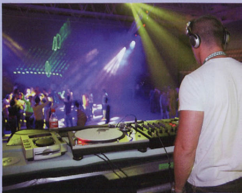
Beata za Železnike se je v Medvodah udeležilo okoli šeststo obiskovalcev.