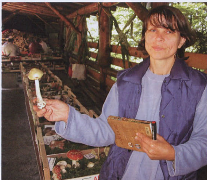
Poznavalka gob Sedija Hasanagič s smrtno strupeno zeleno mušnico

Ljubitelji gob iz Smlednika so na Starem gradu pripravili drugo gobarsko razstavo. Razstavljenih je bilo okoli 150 vrst gob.