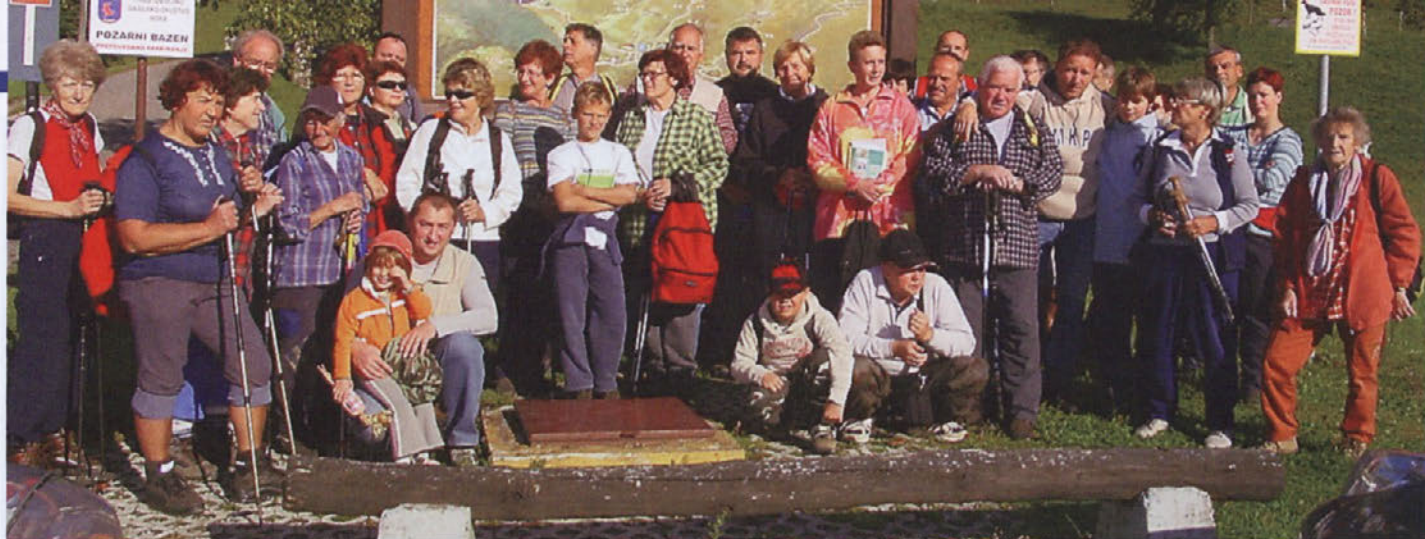
Udeleženci pohoda po Poti suhih hrušk in kraških pojavov