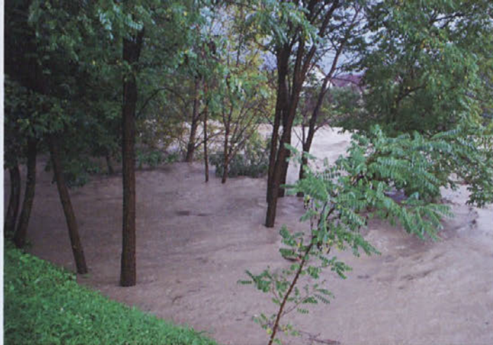
Medvode 18. septembra popoldne.