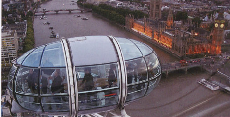
Z razglednega kolesa London Eye z višine 135 metrov gledate na mestne znamenitosti.