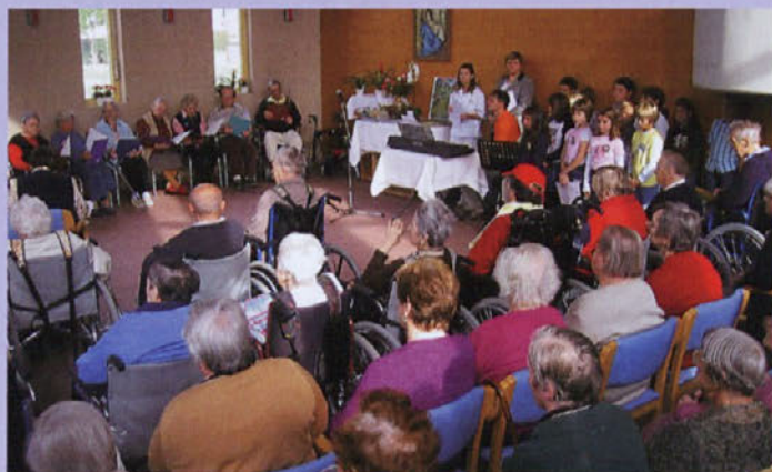
Stanovalci Centra starejših Medvode so dejavnosti predstavili na dnevu odprtih vrat.

Je pa Center starejših Medvode polno zaseden. "Trenutno je skupaj z varovanimi stanovanji v Centru 220 stanovalcev, približno sto na negovalnem oddelku in 120 na stanovanjskem delu. Dom je vseskozi poln, čakalne dobe se glede na povečano število vlog podaljšujejo. Na negovalnem delu je čakalna doba do enega leta, na stanovanjskem delu pa tudi dve leti in več. Prispelih vlog do današnjega dne je več kot sedemsto. Prednostni kriteriji pri sprejemu v dom so bližina stalnega prebiva-