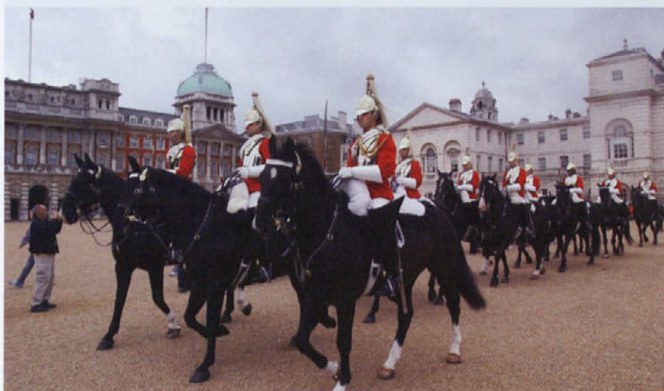
London ponuja veliko - tudi vpogled v imperialno vojaško tradicijo. Na fotografiji menjava konjeniške straže pred eno od palač.