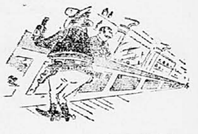
»Ne maram vašega obrabljenega tujačka«

Na vsem svetu so od 15. stoletja dalje nakopali okrog 56 tisoč ton čistega zlata, v vrednosti 63 milijard dolarjev. Od tega ležita dve tretjini v notnih bankah, ena šestina je v rokah privatnikov, ena šestina pa pri industriji in obrti. V tej šestini je vračunano tudi zlato, ki je propadlo zaradi naravnih katastrof in zginito ob raznih nesrečah. Največje zaloge zlata ima Francija. Čeprav so se v povojnih letih te zaloge nekoliko zrahlijale, računajo da imajo Francozi še vedno zlata v vrednosti 3,7 milijard dolarjev.