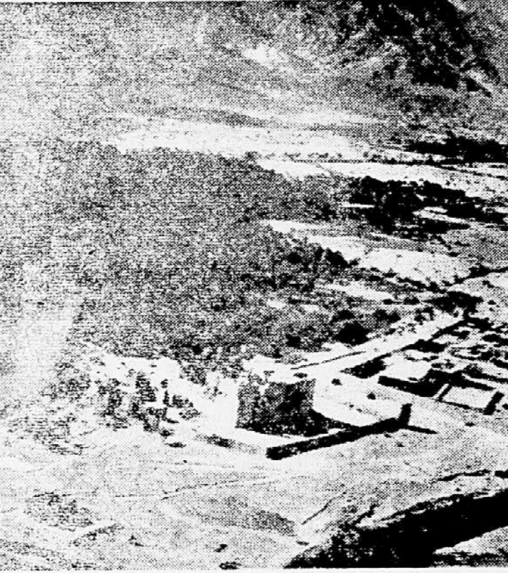
Omanova reka Irki je ena od točk na spornem ozemlju Omanata, ki so jo bombardirala britanska letala.

Kairo, 15. avg. (AFP). Kairski list »Al Misere« piše, da je egiptovski predsednik Naser prejel vabilo grškega kralja Pavla in da bo uradno obiskal sredi novembra Grčijo. List dodaja, da bosta grški kralj Pavle in kraljica Frederika na jesen obiskala Egipt.