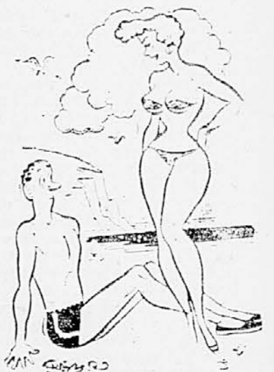
»Narejena je iz novega blaga. Trenutno ga je še zelo malo na trgu.«