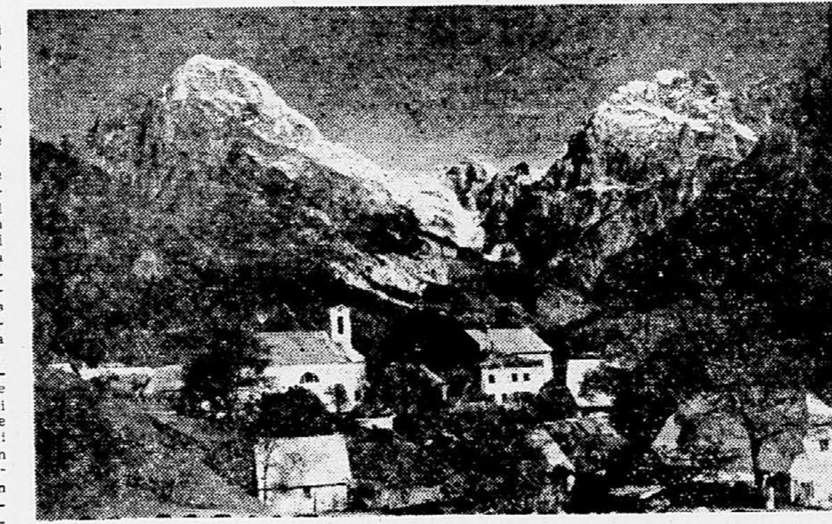
Dolina Koritnice je nedvomno ena najbolj slikovitih dolin v gornjem Posočju. Preprežena je s številnimi svetlozelenimi senošetmi in temnimi gozdovi, tik nad njo pa privablja oči obiskovalca sloviča Loška stena. Nad sklepom doline kraljuje Jalovec (2643 m), poleg njega pa še mogočni Mangart s široko oblikovanim sedlom. Po dolini je speljana pomembna mednarodna cesta, ki predstavlja najkrajšo zvezo med Srednjo Evropo in Jadranom. Posebnost zase pa je predvsem izredno zanimiva mangartska gorska cesta. S komaj 10% vzponom se vije z drznih serpentinah po južovzhodnem pobočju Mangarta in po 12 km doseže na sedlu pod Mangartom (Skrbina v Plazju) 2072 m nadmorske višine. Letošnjo pomlad so je neurja precej poškodovala, po zaslugi bovske mladinske delovne brigade in drugih pa je že nekaj časa spet uporabljena za promet. Na sliki: Log pod Mangartom, največji kraj v Koritnici dolini, ki vse bolj privablja domače in tuje turiste.

zahteval nujen sestanek Var- nosnega sveta OZN zaradi po- lozaja v Omanu.