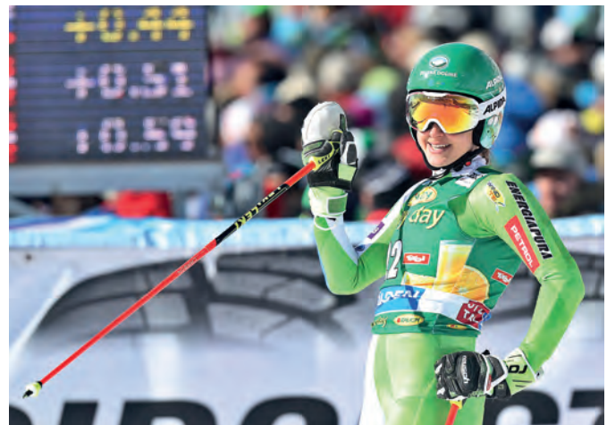
Po sezoni 2014/15 je razmišljala celo o zaključku kariere