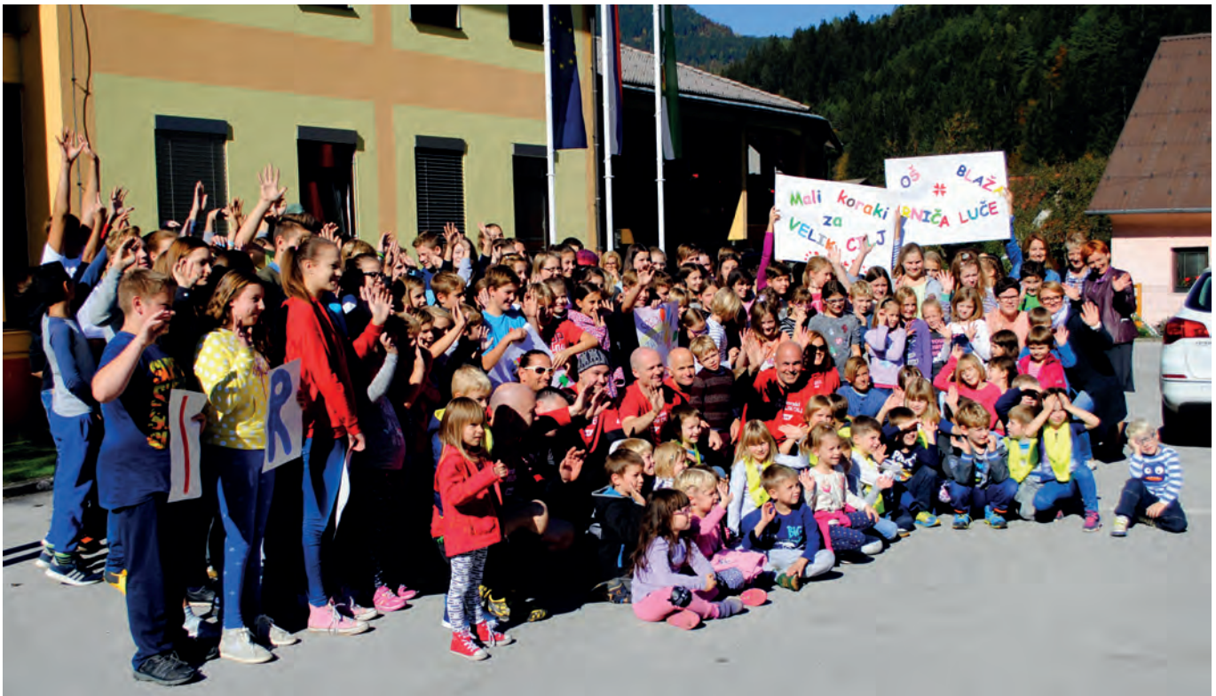
Dobrodelni projekt 'Mali koraki za velik cilj' pomaga socialno ogroženim družinam z otroki

17. novembra smo imeli tradicionalni slovenski zajtrk. Zajtrkovali smo kruh, maslo, med, mleko in jabolka lokalnih pridelovalcev, ob 10.00 pa smo se pridružili vseslovenskemu pevskemu zboru in ubrano zapeli Slakovo pesem Čebelar.