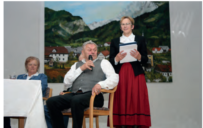
Francl se je spomnil številnih prigod iz snemalnih dni

Ni bilo lahko, ni bilo veliko, bilo je težje od pričakovanj po toliko letih uresničiti že davno zamisel in najti sogovornike, ker mnogih ni bilo več med živimi. Veseli smo, da smo s prireditvijo »ujeli« letošnji okrogli jubilej. Zelo smo bili veseli izjemnega obiska na prireditvi, da ste napolnili domačo dvorano kot že dolgo ne, prisluhnili priložnostnemu programu in lahko po 51. letih po snemanju pogledali del filma, posnetega v Lučah (prenekateri šele prvič). Ja, 51 let mlajši smo bili vsi in nekatere je bilo težko prepoznati toliko let mlajše po prireditvi na razstavljenih slikah iz filma, ob katerih so se številni zadržali pred zaključkom večera in izmenjavali še svoje spomine na tiste dni.