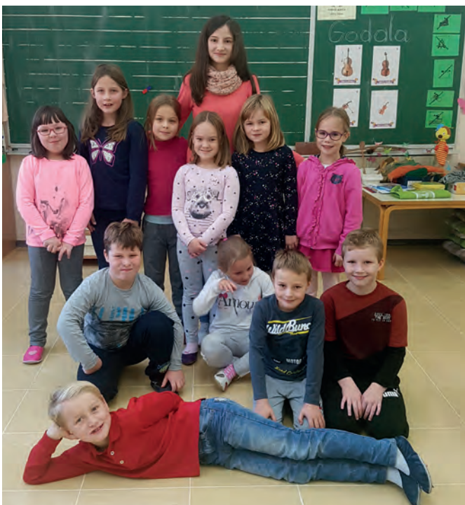
Učenci 8. in 9. razreda so se preizkusili v poučevanju

Ta dan je tudi dan slovenske hrane, zato smo pregovorili o njej – starejši otroci so si ogledali film Ne mečmo hrane stran, za starše pa je bil organiziran roditeljski sestanek na to temo. Izvedeli smo skoraj neverjeten podatek – tretjino hrane vržemo v smeti. POTRUDIMO SE, DA ZMANJŠAMO TO ŠTEVILKO!