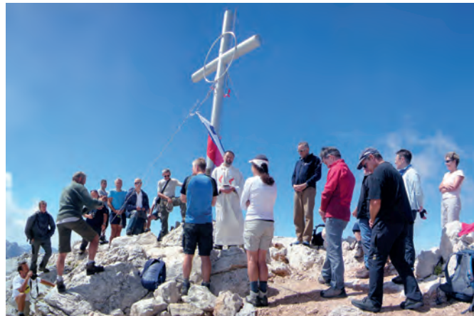
Blagoslov križa na Škrlatici

Skalaši so 2. februarja 1921 ustanovili Turistovski klub Skala kot alternativo Slovenskemu planinskemu društvu (SPD). Zagovarjali so idejo elite, vendar ne v smislu