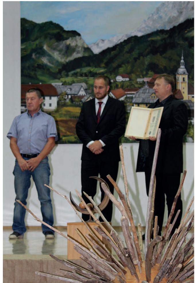
Smučarsko-tekaško društvo in Smučarski klub Luče opravljata izjemno delo na lučkem smučišču

Smučarsko-tekaško društvo trenutno šteje 16 članov, ki tudi z lastnimi sredstvi prispevajo k zglednemu delovanju smučarske dejavnosti v vsej svoji širini in omogočajo, da se mladi rod lahko nauči smučati na domačem smučišču. Poleg tega pa celotno zimsko sezono izvajajo zasneževanje, ko jim to dovoljujejo prave nizke temperature. Redno obnavljajo licence, izvajajo treninge in tekme.