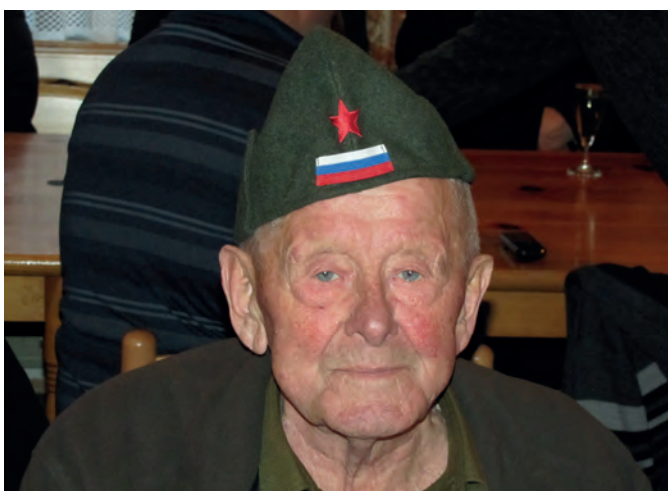
Še vedno je aktiven v Krajevni organizaciji združenja borcev za vrednote narodnoosvobodilnega boja Luče

Mamo so Nemci leta 1942 zaprli, sestro Heleno dali v »lager« blizu Gradca, on pa se je zelo mlad – še pred 18. rojstnim dnevom avgusta 1944 vključil v partizane. V partizanih je bil na Dolenjskem v okolici Žužemberka in Črnomlja, najprej dva meseca v brigadi, potem pa izbran h kurirjem. Po zadnjih močnih bojih v okolici Ljubljane je z inženirsko brigado 7. korpusa ob osvoboditvi 9. 5. 1945 vkorakal v osvobodjeno Ljubljano kot praporščak. Omenil mi je, kako čustven in nepozaben dogodek je to bil in mi pokazal sliko iz knjige o tej brigadi, na kateri je viden kot nosilec zastave, ter dodal, da ima zelo različne spomine na čas med vojno.