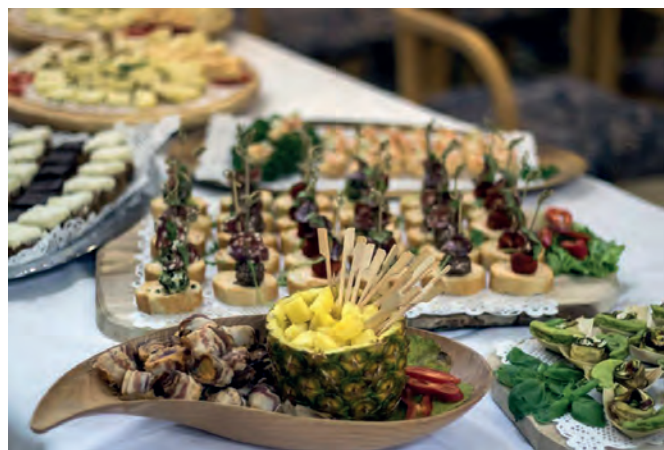
Po proslavi je sledil zabavno-družabni del s pogostitvijo

Štirideset let je minilo od ustanovitve in v tem času se je v okviru delovanja društva zvrstilo že ogromno tekmovanj in drugih športnih dogodkov, udarniških akcij in infrastrukturnih pridobitev, ob tem pa spletlo tudi neskončno število trdnih prijateljev in nepozabnih spominov.