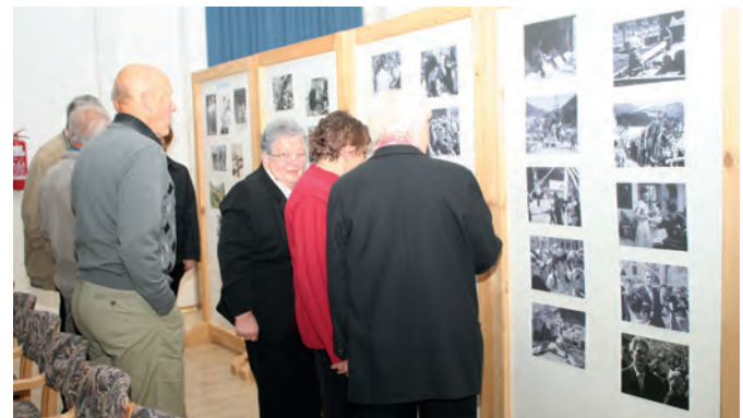
Obiskovalci so po prireditvi z zanimanjem iskali znane obraze na razstavljenih fotografijah