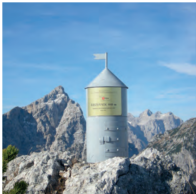
Aljažev stolpič na Križevniku (1909 m)