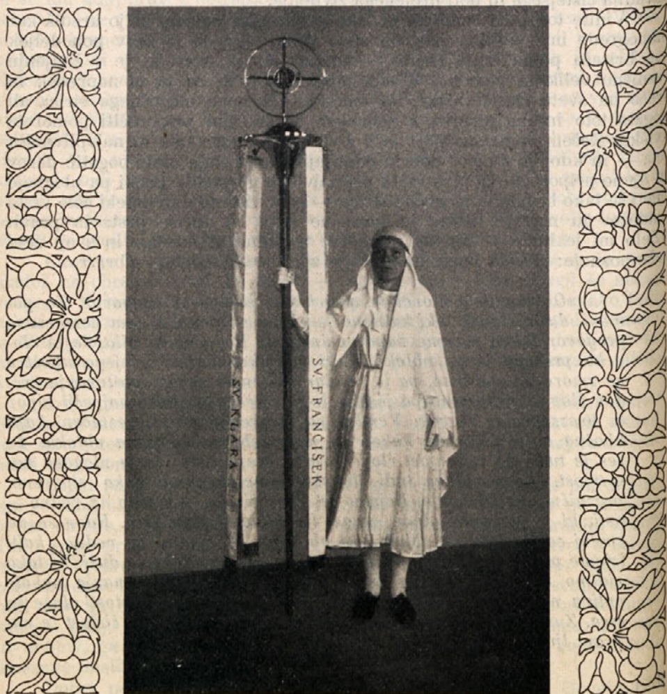
Novi prapor sestric sv. Klare v Šiški

Povedal nam je, da je naš prapor kakor sv. šotor, kamor se zatekamo v zavetje in za pomoč v težkih dneh. Drog, na katerem sloni polobla in ki iz nje raste križ objemajoč hostijo, je simbol trdnosti naših načel. Štirje