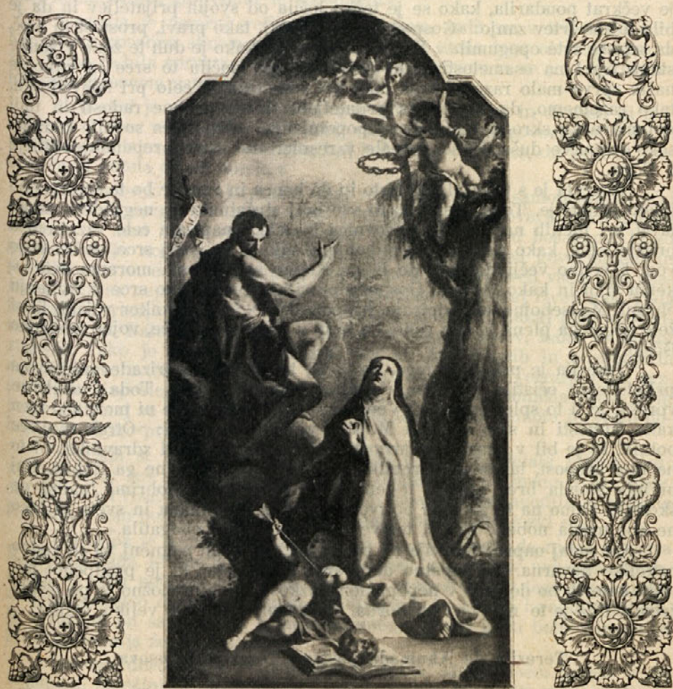
Videnje sv. Terezije

Zlasti pa, ker ji je njen spovednik ponovno zagotovil, da ni na tem nič grešnega. Zaeno pa se je tudi bala, da ji ne bi očitali nehvaležnosti in muhavosti, ko bi brez razloga pretrgala prijateljstvo z osebami, ki so ji bile v resnici naklonjene. Njen spovednik ji je naročil, naj tekom par dni vsak dan moli prav iz srca: »Pridi Stvarnik Sveti Duh...« nato pa naj prepusti vse dobremu razsvetljenju. Naprej naj o tej stvari Terezija sama govori.