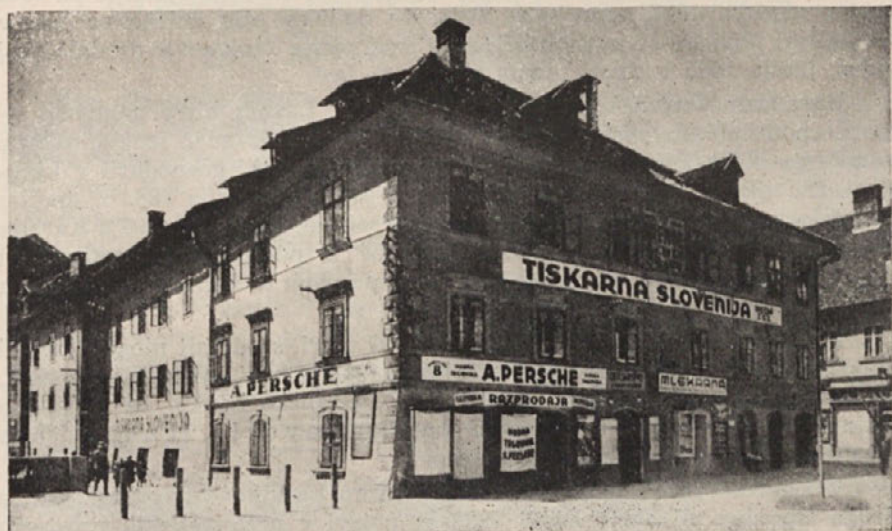
Lasnikova hiša l. 1933. Pogled s trimostja