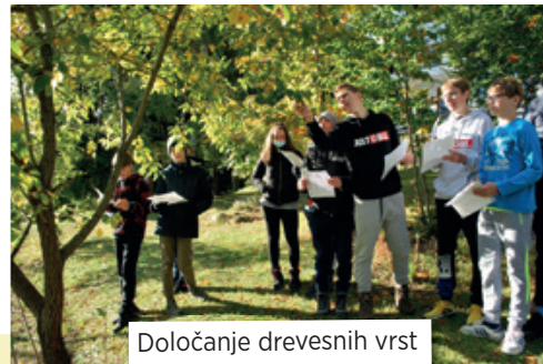
Določanje drevesnih vrst