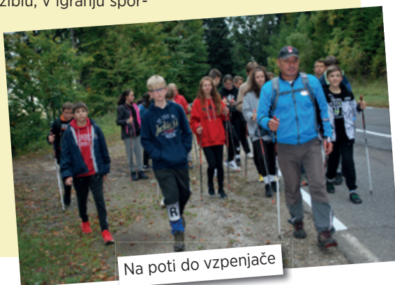
Na poti do vzpenjače