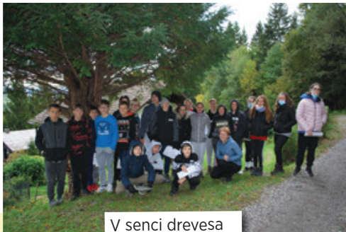
V senci drevesa