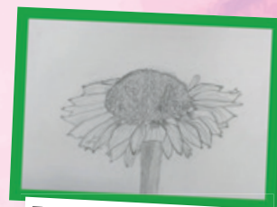
Tomaž Korez, 7. razred

Delavsko društvo hríbouskih kmetij in podeželja želi usem občanom in občankam občine Žetale, mirne in vesele božično-novoletne praznike.