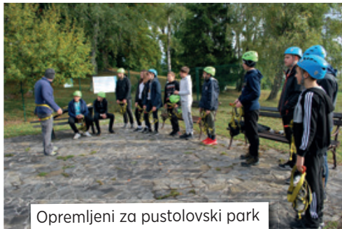
Opremljeni za pustolovski park