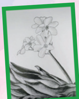
Anja Bukšek, 7. razred