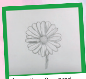
Žiga Klep, 9. razred