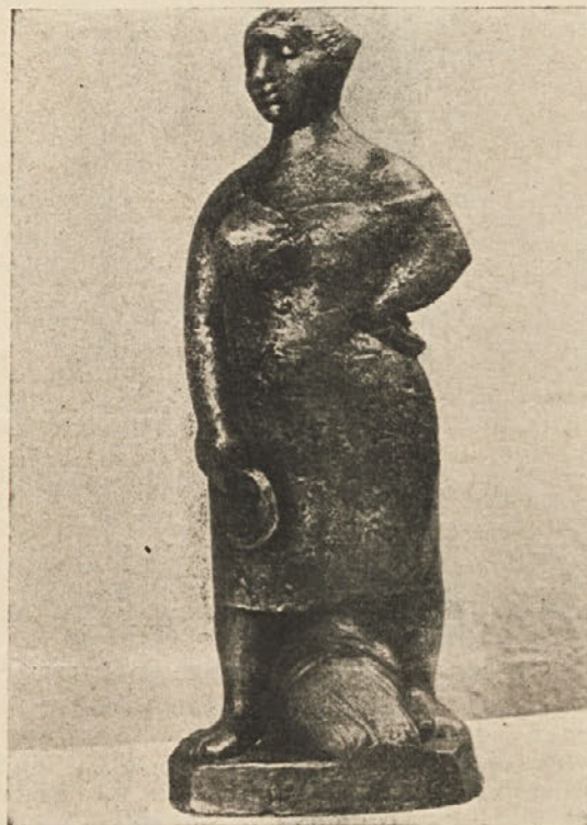
France Gorše, Alegorija poletja, (bron, 1977)