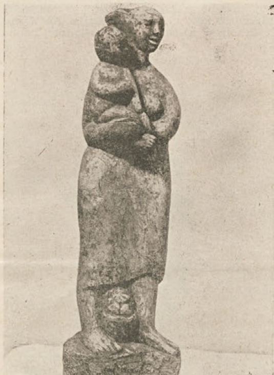
France Gorše, Alegorija jeseni, (žgana glina, 1977)

Mislil sem, da bi postal nekak grafik. To mi je bilo takrat prav blede v zavesti... Če brskam nazaj v tista leta, ne spominjam se, da bi pred štirinajstim bilo kaj tega v meni... Pač: rad sem gledal – deniva slike po cerkvah, križeve pote... To me je privlačilo.