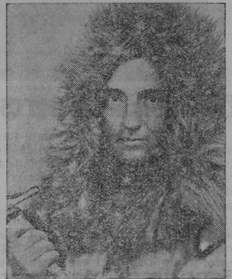
Ameriški admiral Byrd, ki je raziskoval skoro dve leti južni tečaj, se vrača nazaj v domovino.