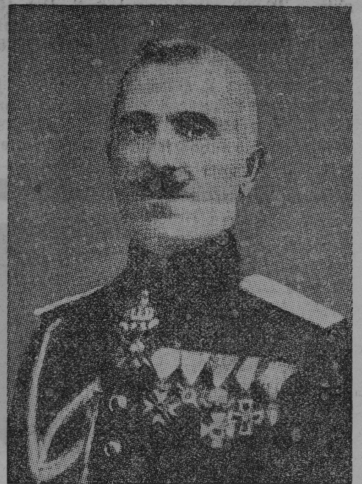
General Zlatev, novi predsednik bolgarske vlade.

Pometamo dalje, dokler je še kaj zimskega blaga. Večur barhent 7 Din, flanela 5.50 Din, volneno 16 Din, snežke 20 Din itd. Stermecki, Celje.