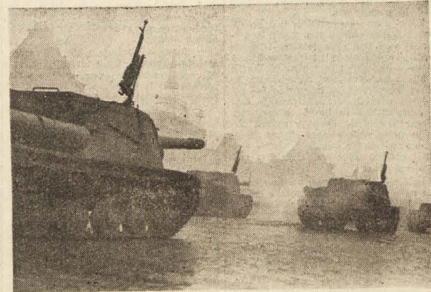
Sovjetski tanki na Rdečem trgu.

na področju Arnheima I. padaleko angleško divizijo, ki pa so jo Nemci obkolili in skoraj povsem uničili. Ta neuspeh je preprečil nadaljnje operacije za očiščenje Sigfriedove črte in prekoračenje Rene. Zavezniške akcije so zamrle. Feldmaršal Montgomery je sklenil počakati z vojnimi akcijami do pomladi in o tem je prepričal tudi Američane. V tem času pa je sovjetska armada izločila iz vojne Rumunijo in začela svoj osmi udarec.