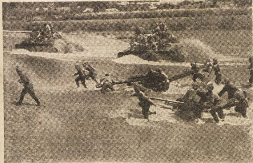
Sovjetski vojaki na prehodu čez reko Sanok na Poljskem.

Leto vojnih akcij 1944. je bilo za Sovjetsko zvezo leto zmag, za zaveznike pa leto »pričakovanih uspehov«. Angloameričani so o svojih operacijah v Franciji v tem obdobju mnogo pisali in govorili, povelečevali so jih kot sijajne zmage, ki naj bi bile pospešile konec vojne. Toda resnični dogodki govore čisto drugače. Po izkrcanju so obšli Angloameričani pri Caenu in St. Lou, dolgo so mečkali »falaisko vrečo«, potem so 4 mesece — od septembra do sredine decembra — počivali, končno pa so, potem ko so jih bile nemške čete kaznovale za njihovo brezdjelje v Ardenih, izgubili prav tisti