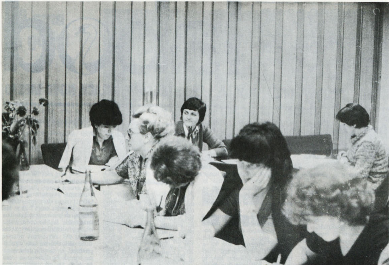
Iz posveta poslovnih sekretarjev