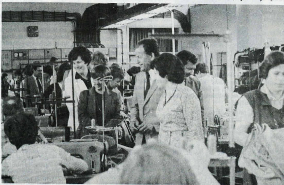
Z zanimanjem so si udeleženci delavskega sveta ogledali proizvodnjo TOZD ZALA.