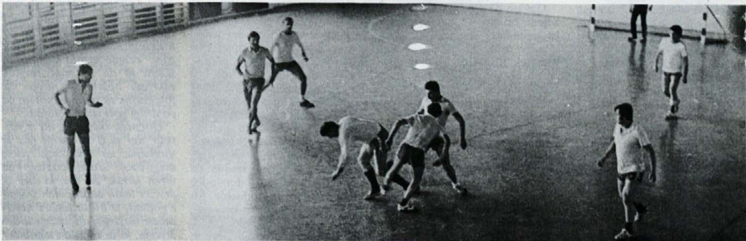
V polčasu je bil rezultat 3:2 za Labod, končni izid pa 4:7 za goste iz Ateksa. Toda ni pomembno zmagati, pač pa sodelovati!