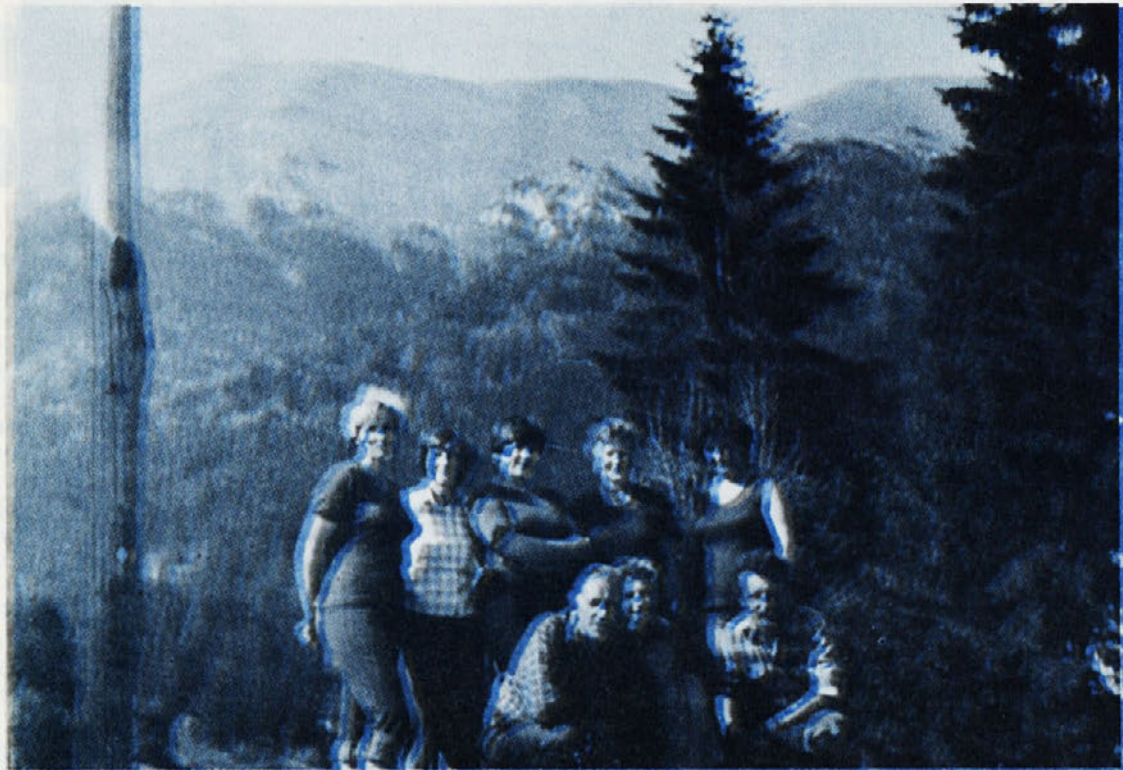
Planinska sekcija v našem športnem društvu je med najbolj delovnimi, pa tudi vse več delavcev se navdušuje za planinarjenje. Posnetek je z izleta na Golico.