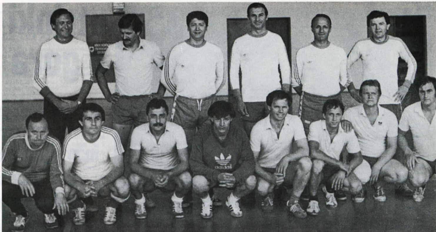
Pred tekmo sta se obe ekipi – Ateksova in naša – Labodova postavili tako, kot se to za nogometaše spodobi in nastal je ta posnetek.