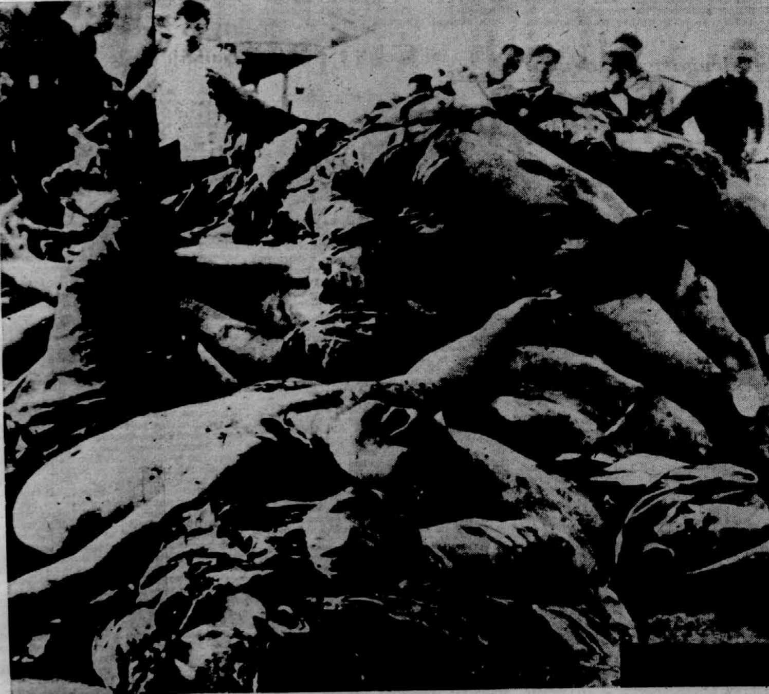
PRIVID IZ NURNBERSKIH PRIČEVANJ Grmada trupel na trgu v mestu Cam Mau je sestavni del psihološke spomiritve vietnamskih vasi

Kenija je danes na razpotju. Kenyatta pa se bliža koncu svoje dolge in trnove poti. Očitno je, da za svojega življenja ne bo mogel odpraviti teh nasprotij, najsi uživa še tako velik ugled. To ni dokaz, da je premalo naredil ali da ni bil dovolj sposoben, ampak zgolj dokaz, da nekatera globoko zakoreninjena nasprotja razrešuje nekaj generacij in da jih celo velike zgodovinske osebnosti ne morejo do kraja odpraviti. Njihov življenjski vek je prekratak v primerjavi s stoletji, ko so ta nasprotja nastajala.