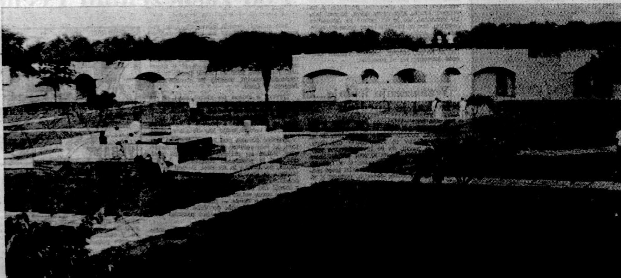
RAJ GHAT V NEW DELHIJU Tu so uspeli Gandhijevo truplo