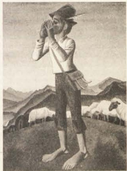
„Pastirci“ – eden izmed filmov, ki jih bomo videli prihodnji teden na Koroskem. (Slika iz knjige: France Bevč: Griharjevi otroci/Pastirci, MK 1979, Ljubljana; ilustriral Ivo Šubic).

● Tretji film „Pustota“ se odigrava na začetku 18. stoletja. Po