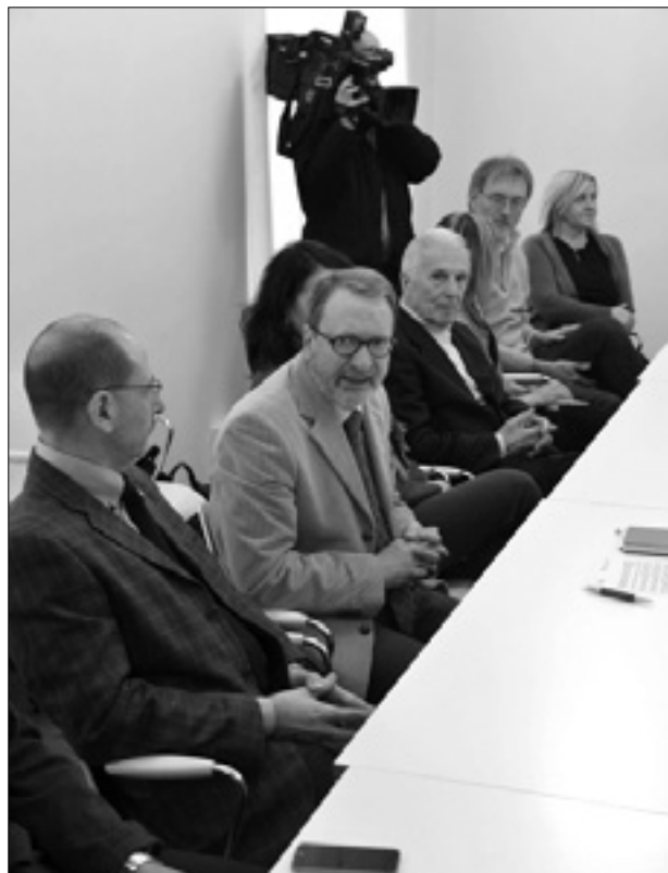
Levo pobudniki znanstvenega raziskovalnega projekta, desno eminentna tržaška stoletnika Boris Pahor in Gillo Dorfles (103 leta)

V povprečju je na Tržaškem stoletnikov dvakrat več kot drugje. Domnevajo, da veliko pomagajo življenjski slog in družabni odnosi.