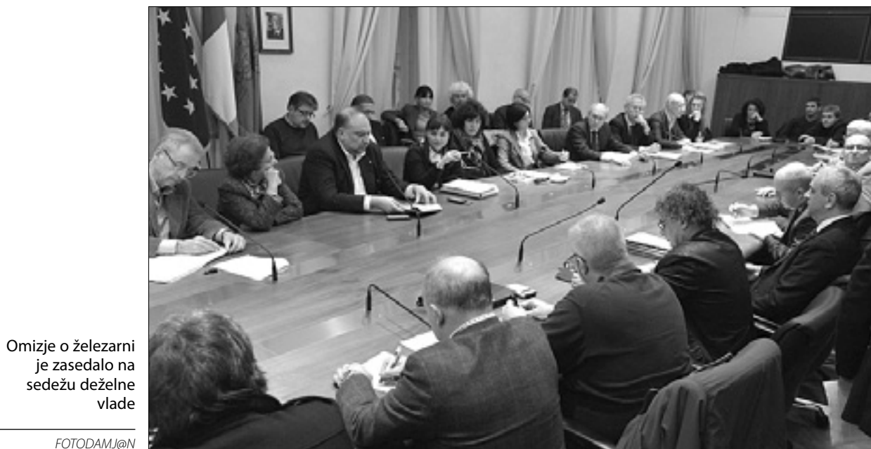
Omizje o železarni je zasedalo na sedežu deželne vlade