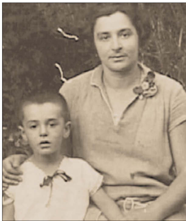
Mali Lelio Luttazzi z mamo Sidonio

Na Trajanovi tržnici (Mercati di Traiano) v Rimu je do 2. februarja na ogled bogata in zanimiva dokumentarna razstava z naslovom »A ritmo di swing«, ki je posvečena slavnemu tržaškemu pevcu Leliju Luttazziju (1923-2010). Gre za prikaz Luttazzijeve zelo pestre življenjske in umetniške poti, ki ga je iz rojstnega Trsta peljala v Rim in nato spet v Trst. Na razstavi je prikazano tudi Luttazzijevo šolanje na Proseku, kjer je bil edini Italijan med Slovenci v razredu na šoli, kjer je poučevala njegova mama Sidonia. Luttazzi (očeta je izgubil kot otrok) je na Proseku kot kratkohlačnik preživel šest let svojega življenja.