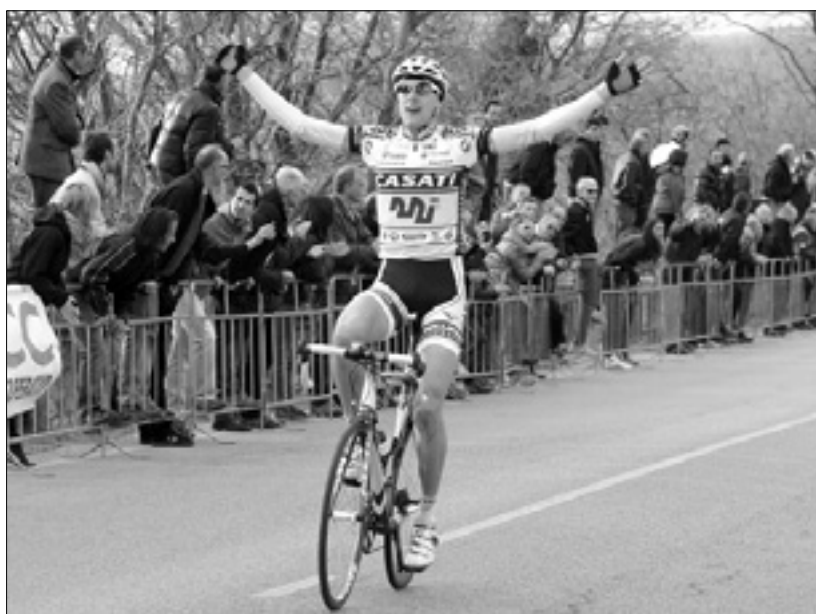
Zmagovalec zaenkrat zadnje Trofeje ZŠSDI Facchini leta 2012

Brez dirke je močno osiromašena tudi kolesarska dejavnost KK Adria. Tega se dobro zaveda tudi vodstvo kluba. Čeprav Pečar poudarja, da nič ni večno in da sicer nekateri člani kluba še vedno zastopajo Adria na raznih rekreativnih dirkah, se niso predali popolnemu malodušju. Klub, ki je na športnem področju toliko let nemalo prispeval k rušenju pregrad med Italijo in Slovenijo (prej Jugoslavijo), tako rekoč ne more iz svoje kabole. Zdej zato resno preučujejo vabilo k sodelovanju, ki so jim ga naslovili organizatorji dirke Gran fondo d'Europa. Obstaja namreč verjetnost, da bo letos start tega kolesarskega maratona (septembra),