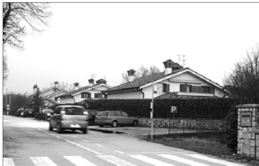
Prve padriške hiše, ko se pripeljemo iz Trebč