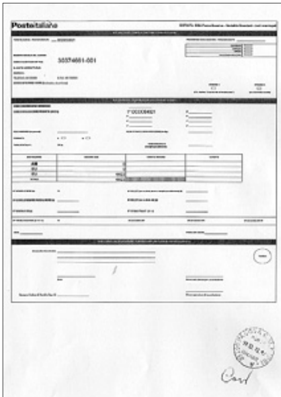
Levo potrdilo o pošiljki položnic; desno poštni žig z datumom 19. decembra 2013

Tako zgonska kot repentabska občina sta se - skupno z devinsko-nabrežinsko občino - za pripravo obrazcev obrnili na podjetje PG Softworks' iz Padove. Izbira ni bila naključna. Uslug tega podjetja se je posluževala tudi prejšnja izterjevalnica, podjetje Esat-