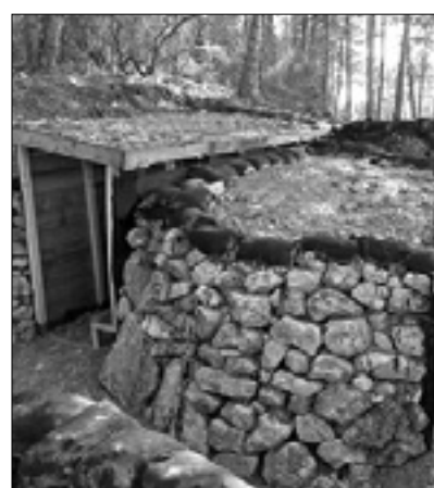
Trziški park na temo prve vojne

V pričakovanju na stoletnico je pokrajina stopila v stik tudi s Fundacijo Goriške hranilnice. Le-ta je zagotovila 50.000 evrov, ki jih bodo porazdelili med društva in ustanove, ki so se z najrazličnejšimi pobudami in projekti prijavile na razpis. Med dobitniki prispevkov je tudi pet slovenskih ustanov: ZSKD se je prijavila s projektom štafete miru, ki bo startala na Trgu Transalpina, SSO pa bo uredil zbirko pesniških in literarnih del, povezanih s prvo svetovno vojno. Krajevno združenje Pevma-Štmaver-Oslavje bo prejelo 2000 evrov za čiščenje in obnovo ostalin prve svetovne vojne v slovenskih vaseh, Ars Atelier pa bo pripravil glasbeni spektakel na temo miru in sožitja med narodi. Temu projektu so namenili 900 evrov, tako kot društvu Danica, ki si je zamislilo vinsko in gastronomsko pot med ostalinami prve svetovne vojne. »Finančno podporo je dobilo tudi združenje CRASG Maria Muta, ki skuša ovrednotiti italijanski del Sabotina po zgledu in v povezavi s Parkom miru na slovenski strani. Kras 2014+ je s projektom Poti miru tesno povezan, zato pobudo podpiramo,« pravi Černičeva, ki pa pogrša sodelovanje in podporo goriške občine. (Ale)