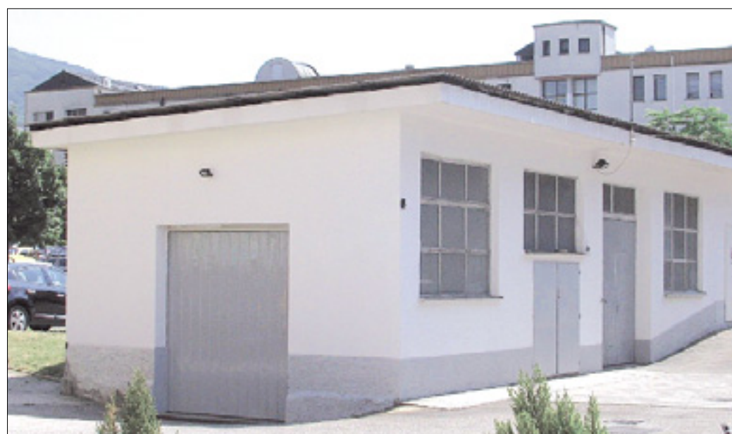
Lokacija prizidka za zdravstveni dom

Mestna občina je postala lastnica dobrih 150.000 kv. metrov zemljišč