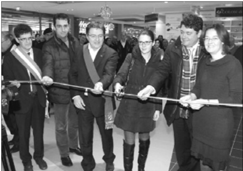
Obredni prerez traku (zgoraj) in ogled multimedijških vsebin

Čeprav je slovesno odprtje potekalo včeraj, je infotočka začela delovati minuli konec tedna. »Čez vikend jo je že obiskalo okrog 70 ljudi,« je dejal uslužbenec pokrajine, stažistki pa sta povedali, da je večina dosedanjih obiskovalcev doma iz dežele FJK. Zanimale so jih predvsem pobude ob stoletnici vojne, gastronomska ponudba in Kras. (Ale)