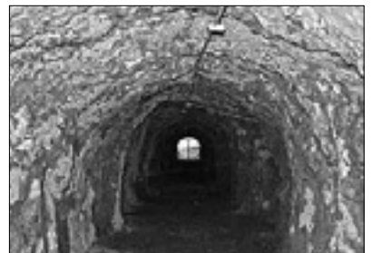
Kaverna na Debeli Griži

Projekt Kras 2014+ pa ne predvideva le gradbenih del. »Promocijske pobude, ki so prav tako pomembne, so že v teku,« je poudarila odbornica, po kateri je pokrajina v sodelovanju s Trgovinsko zbornico financirala več ekskurzij z avtobusom »eStoriabus. Le-