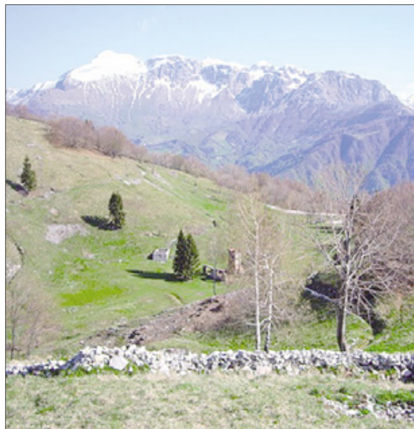
Prelaz Solarji, čez katerega naj bi šel daljnovod