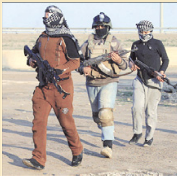
Sunitski bojovniki v Faludži

Bojevanje se medtem nadaljuje v provinci Anbar, kjer so iraške varnostne sile vpete v spopade z uporniki, povezanimi z Al Kaido. Ti nadzorujejo celotno nekdanjo utrdbo upornikov, Faludžo, ter dele prestolnice province, Ramadija. Včeraj so uporniki napredovali in prevzeli nadzor nad dvema pomembnima točkama - mestom Saklavijah zahodno od Faludže ter pomembno četrtjo Ramadija, Malab. (STA)