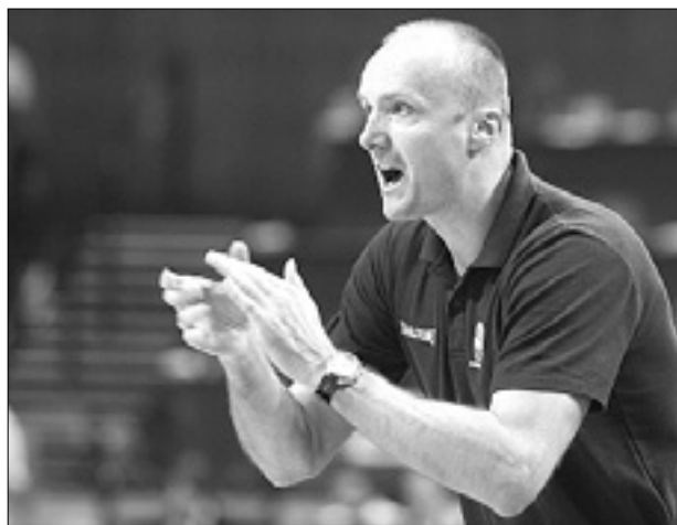
Jure Zdovc je nazadnje vodil Slovenijo leta 2009 na EP na Poljskem

«Jure Zdovc je bila logična in praktična edina izbira. Izvršni odbor ga je imenoval soglasno, saj se vsi zavedamo, da ima