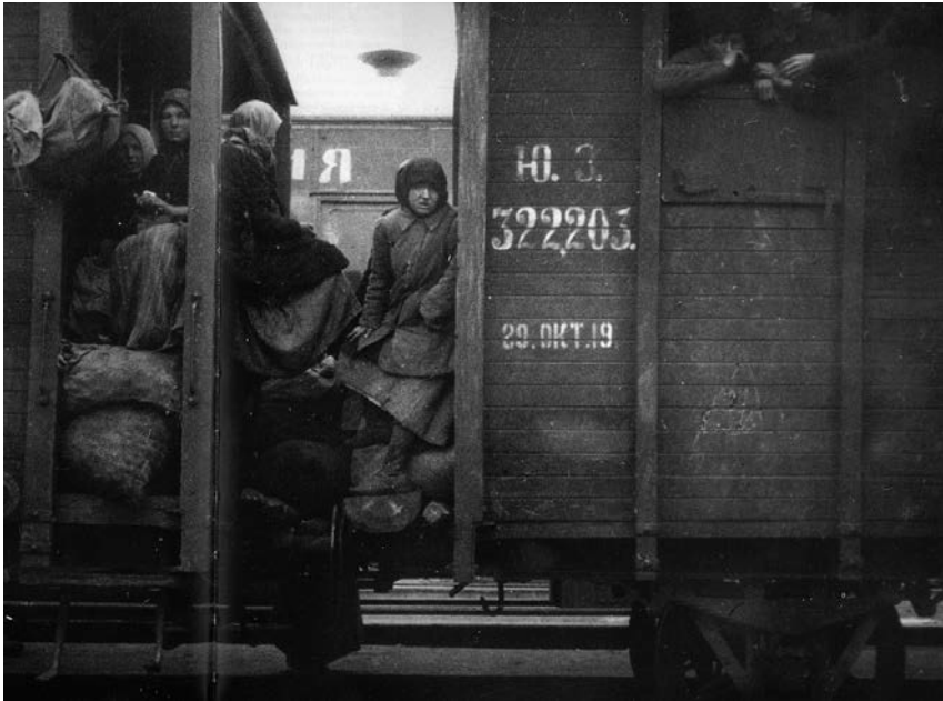
RUSKI BEGUNCI MED VAGONI TOVORNEGA VLAKA, 1919. VIR: HTTP://WWW.RUSKEREALIE.ZCU.CZ/R2-5A.PHP .

imenovanih Nansenovih potnih listin, ki bi beguncem omogočali prosto gibanje in prehajanje meja zaradi združitve družine ali iskanja zaposlitve. Nansenov cilj je bil zagotoviti beguncem prost vstop v države, “kjer bi se imeli možnost sami preživljati”, 6 njegov program pa naj bi beguncem pomagal, da bi postali migranti, in s tem sami dejavno reševali svoj položaj. Če bi begunci lahko postali migranti – s poudarkom na tem, da bi to v osnovi zagotovilo njihovo ekonomsko samozadostnost – bi bilo njihovo vprašanje enostavneje rešiti. Učinkovita rešitev za izgnanstvo in pomanjkanje je bila primarno prepoznana v svobodnejšem prehajanju meja in kontinuiranem gibanju.