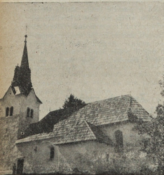
Cerkev na Osojniku

njenih v istem letu. »Če je imel vsak drugi ločeni zakonski par samo enega otroka, je ostalo tako 500 otrok brez enega roditelja. Otrok brez očeta — ali brez matere! Otrok — sirota, kljub temu, da sta oba roditelja še živa!« Tako čitamo v ljubljanskem dnevniku.