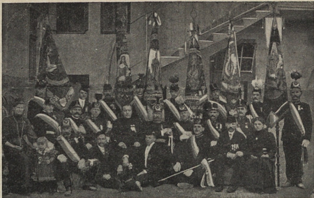
Slovenci iz Renskega in Westfalskega v Ljubljani 24. 8. 1913, ob priliki 4. katoliškega shoda

Bilo je pripravljeno že romanje v Kevelaer, a škofa še ni bilo. Nekateri še niso verjeli, če bo res prišel. Ko pa so ga na postaji zagledali stopiti z vlaka, so zaorili prisrčni »živio« klici in cerkvena godba je zaigrala »Hvala večnemu Bogu!« V ogromni procesiji smo šli do bazilike, kjer je imel Prezvizišeni kljub dolgemu potovanju pontifikalno sv. mašo. Po popoldanski pridigi se je škof podal z romarji v