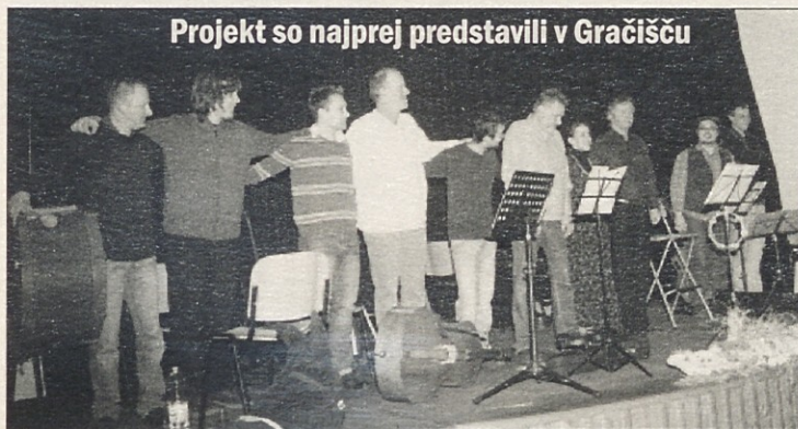
Projekt so najprej predstavili v Gračišću

Vsem so znane Šavrinke, ki so s svojim trgovanjem hodile globoko v notranjost Istre in reševale na ta način preživetje svojih družin ter družin, s katerimi so trgovale. Prav gotovo je marsikateri melodija in pesem prišla iz notranjosti Istre v današnji slovenski del Istre tudi z njimi.