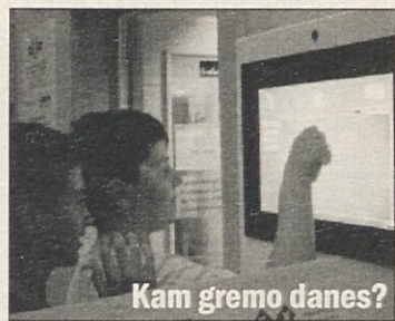
Kam gremo danes?