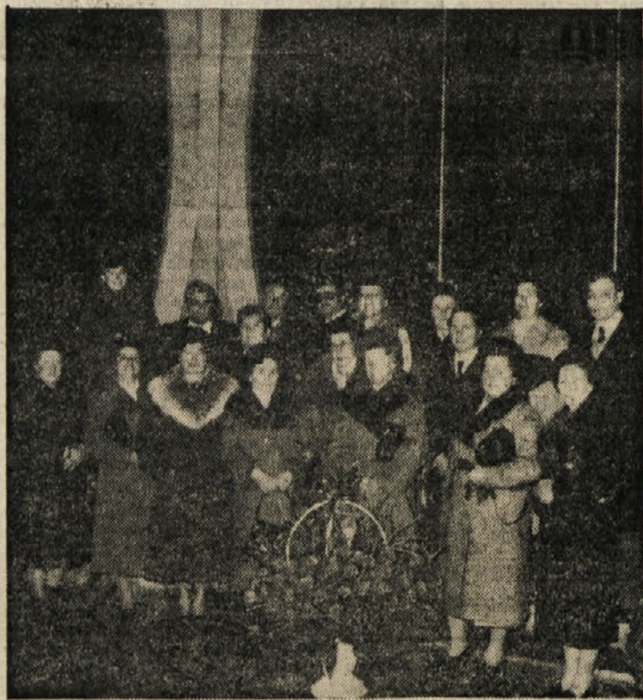
V soboto zvečer so se pred spomenikom NOB v Zgoniku zbrali 50-letniki iz zgoniške občine. K spomeniku so položili košaro rdečih nageljnov, nato pa so se zbrali na družabnem večeru v gostilni Volnik v Repnu