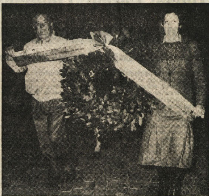
Delegacija bivših aktivistov OF iz dolinske občine je ob tej priložnosti ponela venec k občinskemu spomeniku padlim v NOB