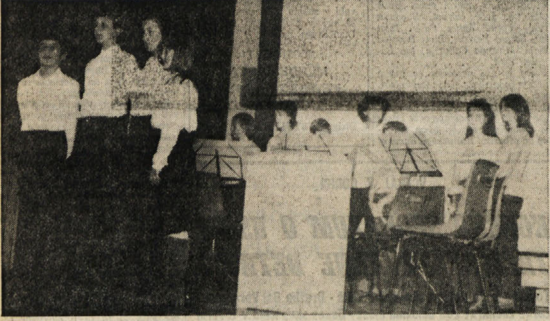
Na proslavi so nastopili dijaki dolinske nižje srednje šole z recitacijami in v sodelovanju zbora kljunastih flaut