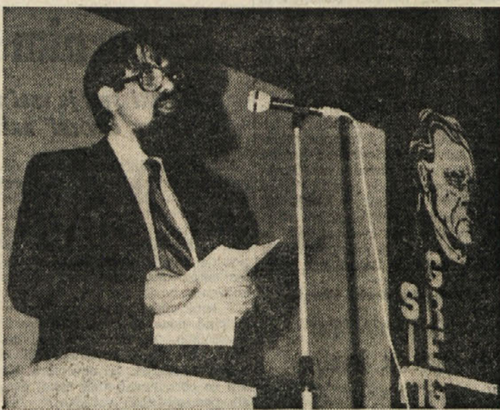
Na proslavi je bil slavnostni govornik pisatelj in pesnik Ciril Zlobec, ki je lik in delo pesnika povezal z današnjim časom