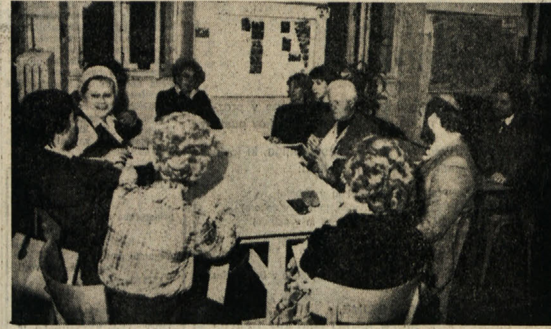
V petek je bil na osnovni šoli v Barkovljah prvi sestanek odbora za poimenovanje barkovljanske šole po pisatelju Franu Saleškem Finzgarju