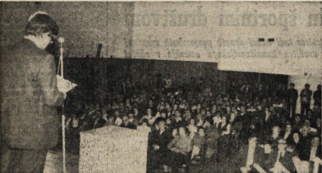
V četrtek zvečer je bila v nabito polnem občinskem gledališču «France Prešeren» v Boljuncu proslava Simona Gregorčiča, ki jo je priredila dolinska nižja srednja šola ob obletnici pesnikove smrti