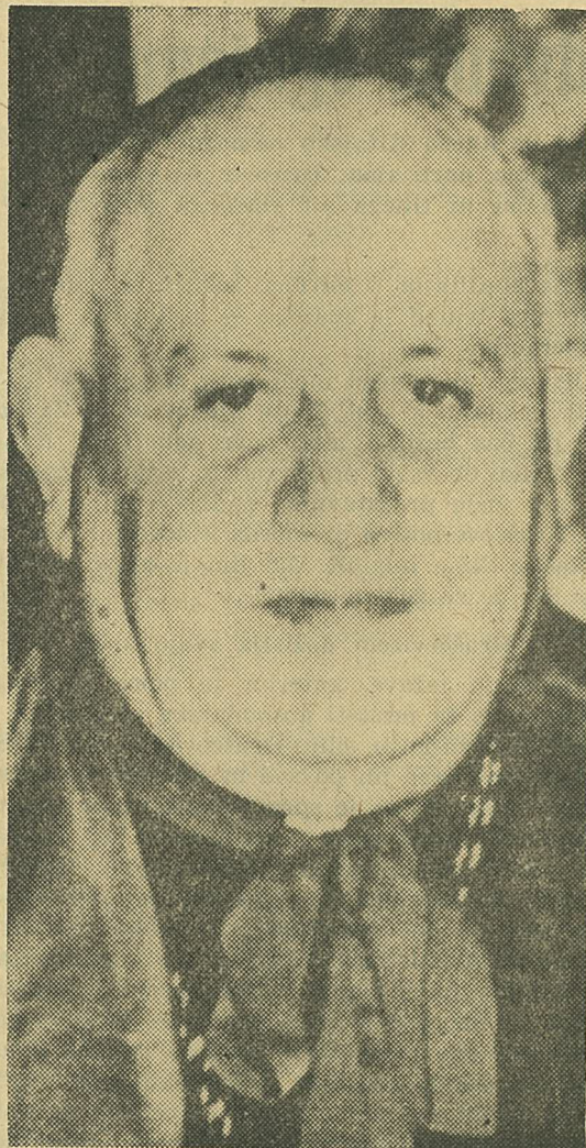
Počivaj v Gospodu, sv. oče!

Sedaj je šel po plačilo k Onemu, v čigavem imenu je delal in čigav namestnik je bil. Lahko je pravičniku oditi. Ovčice, bodisi tiste na zelenem pašniku ali tiste v trnju, pa bodo pogrešale zares dobrega pastirja!