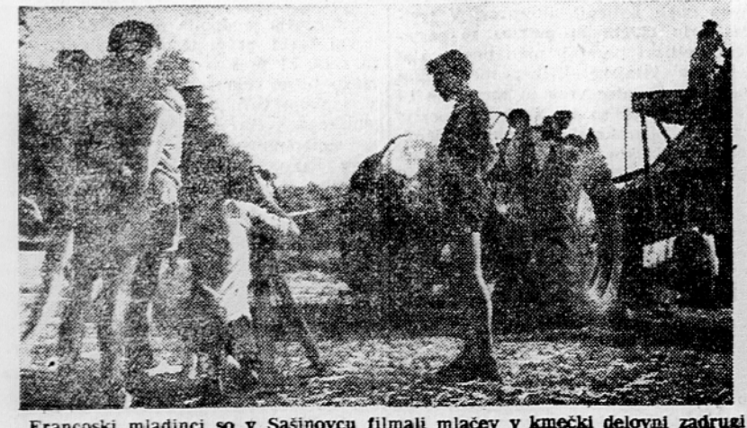
Francoski mladinci so v Sašinovcu filmali mlačev v kmečki delovalni zadrugi

V soboto in nedeljo, 5. in 6. avgusta bo pod Storžičem, kjer so avgusta 1. 1941 padli prvi partizani, velik partizanski tabor. Na prostoru, kjer je stala stara kočja, ki so jo zažgali Nemci in so v njej zgorjele prve žrtve okupatorja, so člani Zveze borcev in Planiškega društva iz Trčevca postavili velik spomenik — živo skalo, v obliki plamena. V skalo so vklesali imena padlih partizanov.