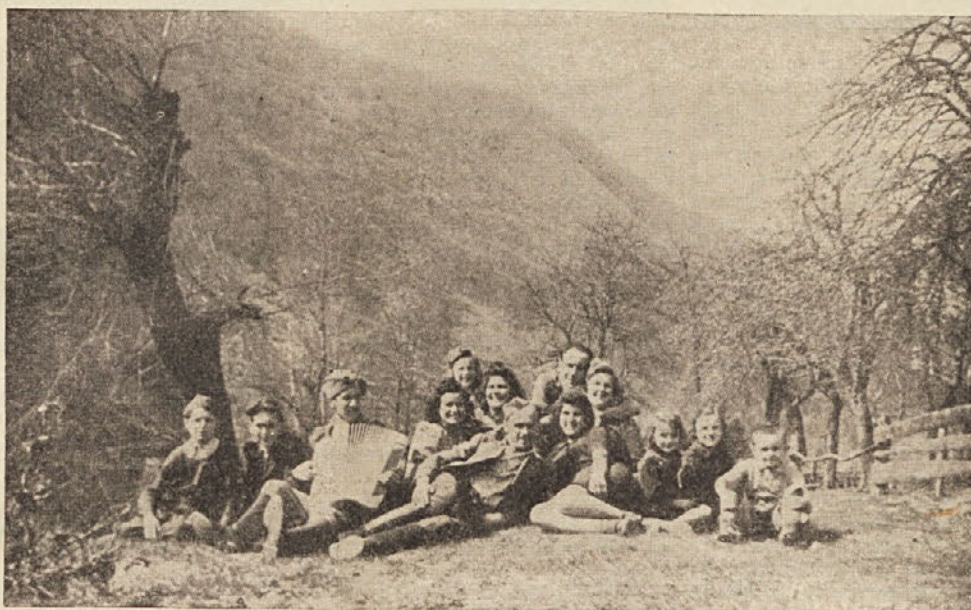
Mladina iz baze 13-23 v vasi Bilpa ob Kolpi leta 1944