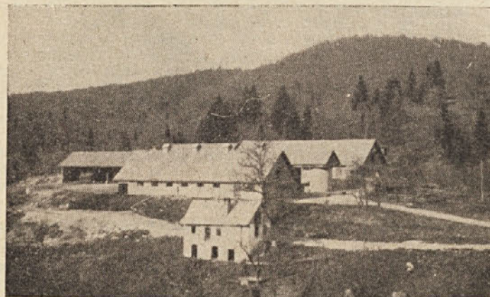
Hlevi KGP v Knežji lipi

Za štipendiste, ki jih štipendira ObLO Kočevje, je v letošnjem letu predvidenih 1 milijon dinarjev. Knjižnice prejmejo 200.000 dinarjev, uprava Šeškovega doma pa 1 milijon din.