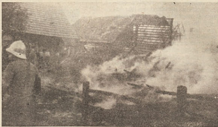
Požar v Ribnici