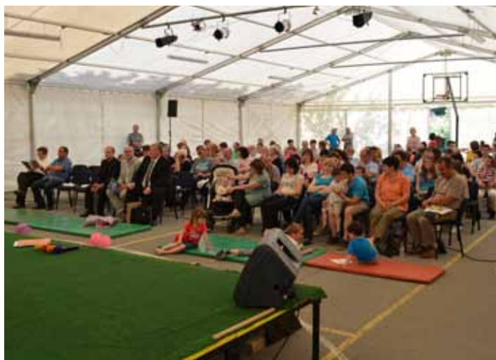
Zbrani udeleženci prireditve ob 120-letnici šolstva na Vrhu