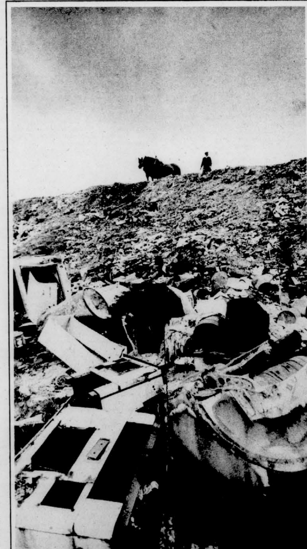
Po geslu: Vrzi kamorkoli, česar ne potrebuješ