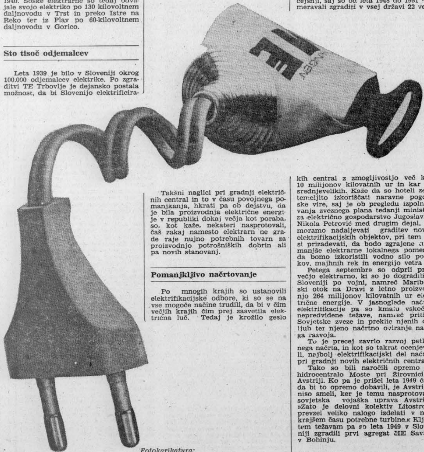
Fotokarikatura: Stane Jagodić