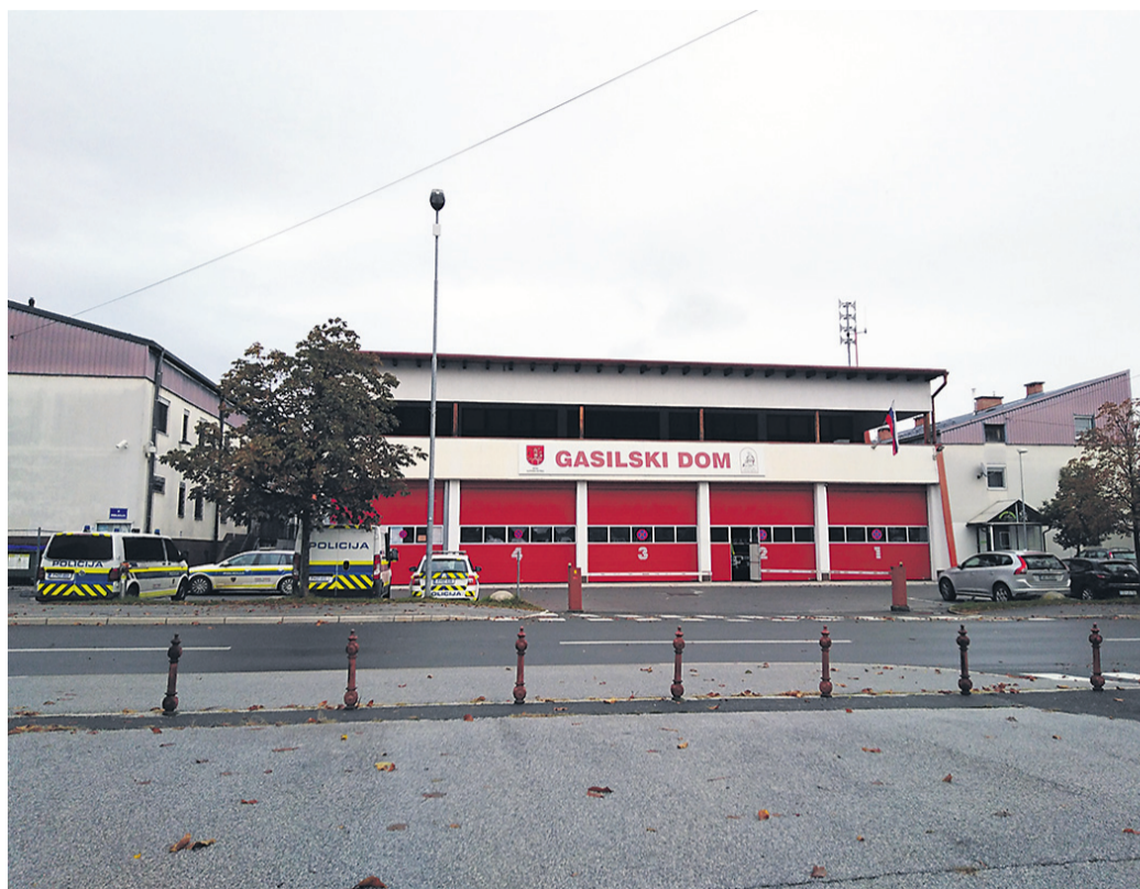
Na Kolodvorski ulici v Slovenski Bistrici so stanovanjci pol leta živeli v strahu.