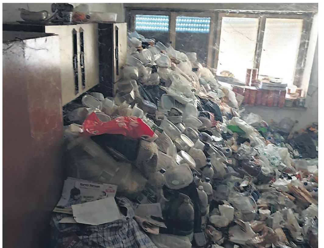
Mojca Vtič Pogled v stanovanje ...

kazenski zakonik. Slednji grožnjo opredeli kot, kdor komu, zato, da bi ga ustrašoval ali vznemiril, resno zagrozi, da bo napadel njegovo življenje ali telo ali prostost ali uničil njegovo premoženje velike vrednosti, ali da bo ta dejanja storil zoper njegovo bližnjo osebo. Toda kot opozarjajo na policiji, pri dokazovanju kaznivega dejanja ne zadostja zgolj dejstvo, da se je oškodovanec zaradi grožnje prestrašil in počutil ogroženega. Da postane grožnja kaznivo dejanje, »mora biti takšne narave in intenzitete, da je pri drugem objektivno zmožna povzročiti občutek strahu za življenje ali telesno celovitost. Za pregon pa mora oškodovanec podati predlog za pregon, ovadbo – lahko sodišču, državnemu tožilstvu ali policiji. Slednja je lani obravnavala 1.609 kaznivih dejanj grožnje, z rezultati kazenskih postopkov (zaporna oz. denarna kazen) pa ne razpolagajo.