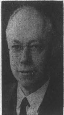
Senator Robert A. Taft

There should not be the slightest question where the allegiance of Ohio Republicans belongs in next Tuesday's primary election, Senator Robert A. Taft merits well of the voters of the state which he has served so valuably; of which he is both native son and favorite-son; and whose family for three generations has been illustrious in public affairs. The name of Taft; nationally is synonymous with Ohio, which stands second only to Virginia, as a mother of presidents. Weighted against him, Harold E. Stassen appears as a well-meaning and ambitious young man; but also as something of an upstart and intruder. His position on public issues is vague and immature beside that of Senator Taft. It is theorizing, as against knowledge. On the basis of experience alone, there is no comparison between the two men. Stassen is prone to find easy solutions to problems—to toss off glib answers. Taft has been earnestly, carefully framing his solutions and answers into legislation—into laws which actually work. It is one thing to propound an academic solution to a problem, and quite another to translate the proposal into reality. Says the Cleveland Plain Dealer, in announcing its support of Taft: "A rejection of Taft's Ohio Republicanism not only would constitute ingratitude, but would be hailed by his enemies as a repudiation of his leadership in the Senate."