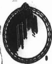
PLATE GLASS MIRRORS Made to Order and Re-Silvered

Furniture Tops, Plateaus, Monograms, etc. Rock Crystal Cut Glass Goblets, Sherbets, Salad Plates Cut Glass, etc.