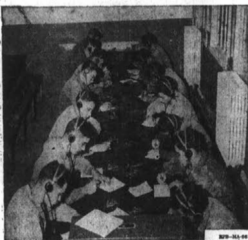
Future dot-dash experts receive instructions in sending and receiving Morse code. After completing their training, these soldier-students will fill important jobs with the Army Ground Forces. These young men are typical of the many high school graduates who selected the kind of training they wanted under the U. S. Army Technical School Plan.