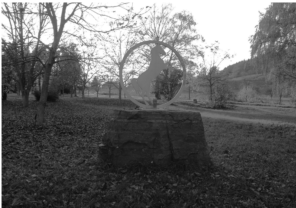
Slika 3: Spomenik sintskim žrtvam holokavsta v Begunjah.

Tudi 79 let po koncu druge svetovne vojne, v kateri je bil holokavst najhujša oblika kršenja temeljnih človekovih pravic in svoboščin brez primere, mnogi raziskovalci te tematike poudarjajo, da usoda Romov že med drugo svetovno med vojno ni bila deležna posebnega zanimanja. Zato ne preseneča, da se tudi po končani vojni leta 1945 o Romih in njihovi tragediji sploh ni hotelo nič vedeti. Za genocid nad Judi se je vedelo in se ga je začelo preučevati, genocid nad Romi in Sinti pa je bil desetletja povsem pozabljen. Tudi v Sloveniji so se raziskave o tem začele šele pred dobrima dvema desetletjema in pol.