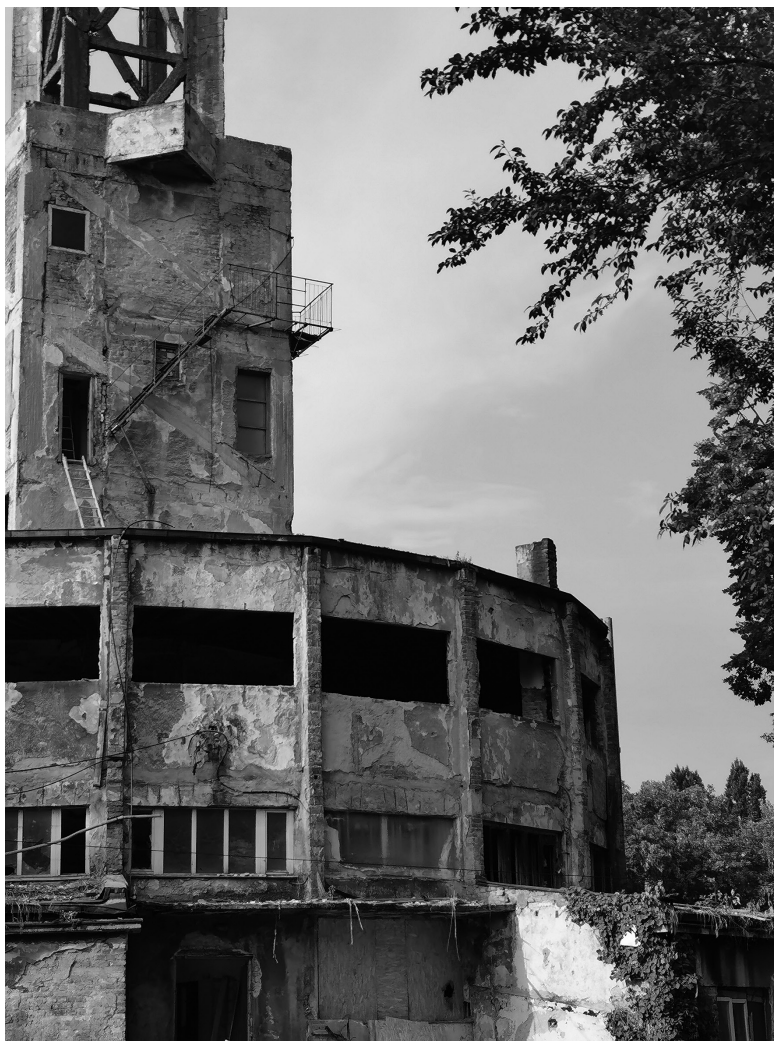
Slika 2: Ostanke taborišča Staro Sajmište, Beograd.

zaprli v taborišča. Po doslej objavljenih navedbah največ v taborišče Staro Sajmište 25 .