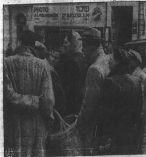
Skoro vsako noč nalepijo palestinski Judje nove lepake v Jeruzalemu, da jih bero ljudje naslednje jutro. Poli cija je spčetka trgala te lepake, a sedaj pa se je tega dela že naveličala. Gornja slika nam kaže skupino Judov, ki bero te lepake, ki navadno nosijo podpis "Bojevniki za svobodo Izraela."

rično leto. Ta okraj je med vojno silno trpel v domači vojski med partizani in njihovimi nasprotniki. Orodje je prišlo po UNRRA.