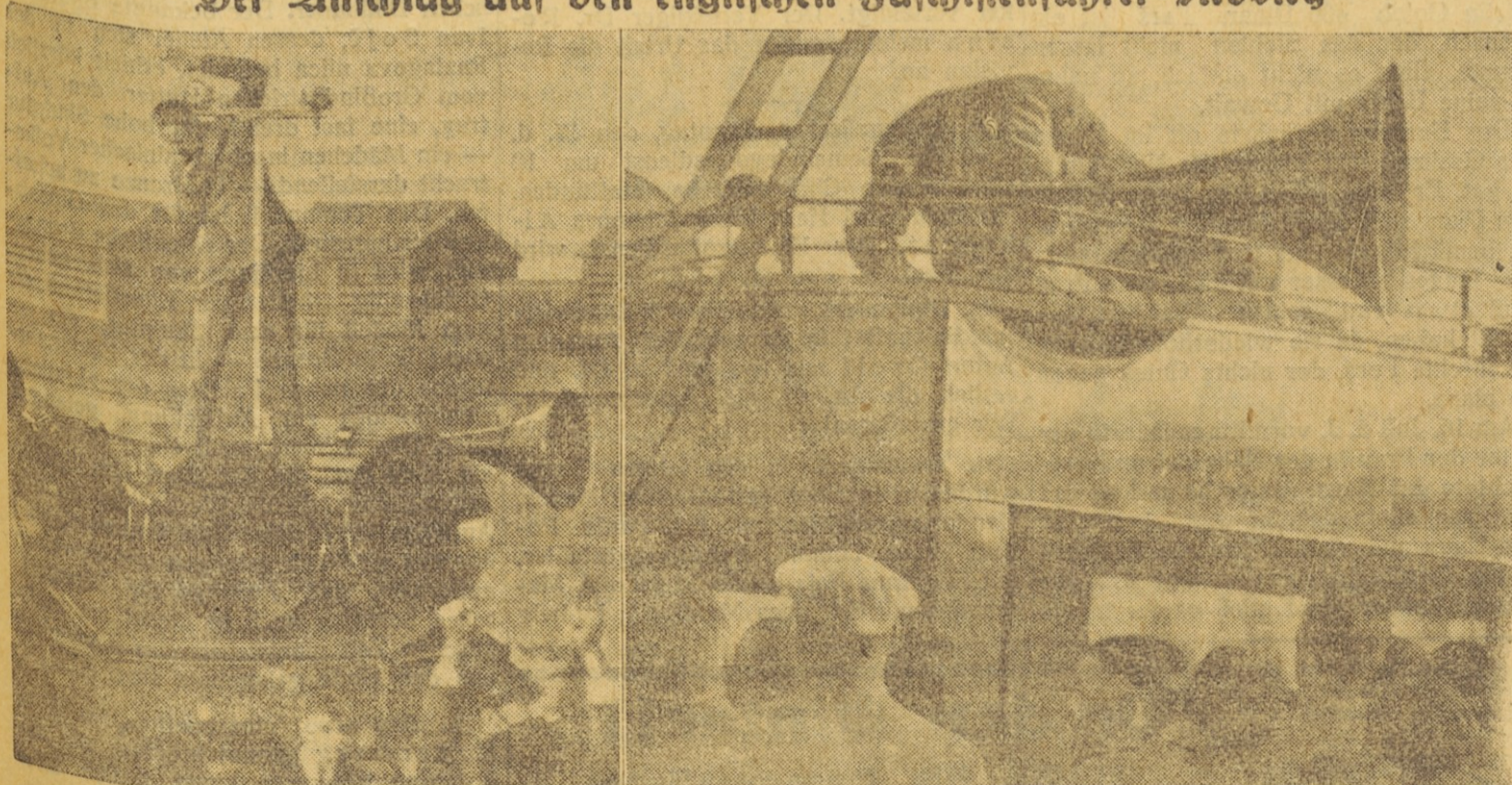
Der Führer der britischen Faschisten, Sir Oswald Mosley, der in Liverpool vor etwa 8000 Menschen, meist Gegnern seiner Partei, sprechen wollte, wurde, bevor er das Wort zu seiner Rede ergreifen konnte, von einem Steinhagel der Gegner überschüttet. Dabei traf ihn ein Stein an der Stirn, sodaß er blutüberströmt zusammenbrach. Diese beiden Bilddokumente veranschaulichen den Hergang.