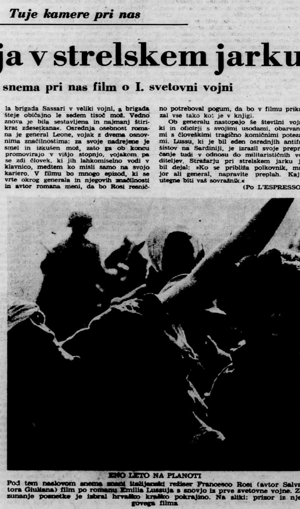
ENO LETO NA PLANOTI Pod tem naslovom snema sredi italijanski režiser Francesco Rosi (avtor Salvatora Giuliana) film po romaniu Emilija Lussuja s svojno iz prve svetovne vojne. Za znanje pesnetke je izbral hrvaško kraško pokrajino. Na sliki: prizor iz njegovega filma

Na nek način je Sternberg zaradi svoje občutljivosti dedič romantike, kot navdušen ljubitelj dovršenosti in čiste umetnosti pa začenja kasneje premoščati naprotja med realizmom in idealizmom s tem, da sicer v mnogih melodramah ali posebnih, odmaknjenih zgodbah z baročno pestrostjo in fascinirano nastopajočih ustvarja čudno, skrivnostno korespondenco med svetom čustvenosti in svetom nečesa podzavesnega, skrajni mističnega. Zaupljivost njegovega sveta je zagrnjena, poezija, v kateri plavajo njegovi junaki, je skoraj muzikalizirano zborovna. Ali je bil v tem samo upor Sternberga pred realizmom zvočnega filma, ki se je največkrat ustavljal samo pri reportažah in dokumentu ali je bila to pot človeka, ki je