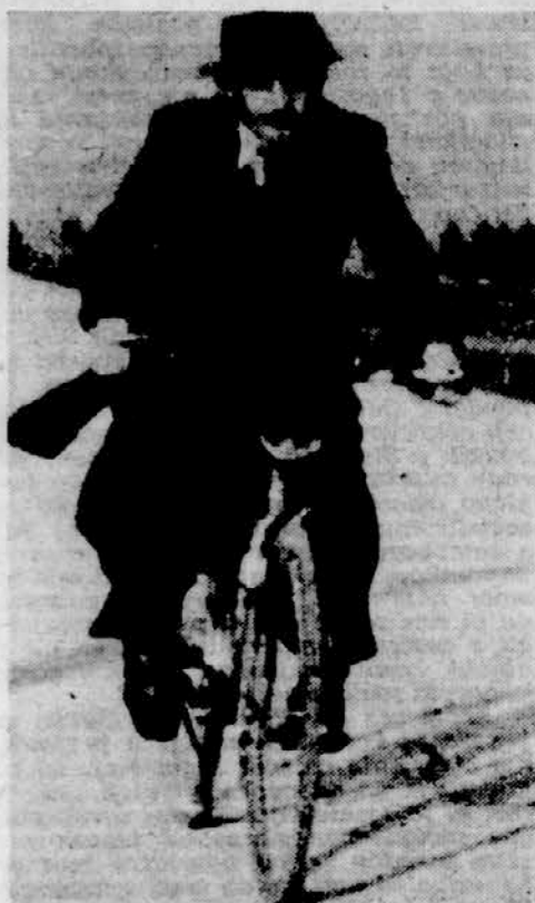
ILEGALCI NA KOLESU

Občudujem ga, ker je sposoben se danes, pri šestdesetih letih, toliko ustvarjati. Ne samo kolébinsko. Občudujem njegovo bogastvo misli. Nedvomno je v današnjem