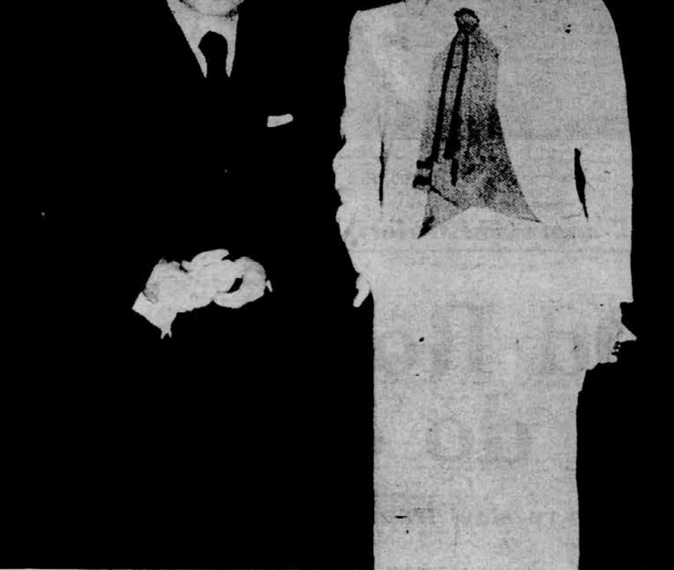
MOJSTER IN NJEGOVA IGRALKA Josef von Sternberg in igralka, ki jo je za film odkril in uveljavil v številnih vlogah, Marlene Dietrich.

Cepprav je še vedno predvsem poslan kot oblikovalec filmskih podob Marlene Dietrich, je bil Sternberg v resnici eden najbolj nadarjenih in izjemnih osebnosti filma in je eden njegovih klasičkov. Pripadal je poamerikanizirani skupini evropskih režiserjev ki so se uveljavili ob vrhu nemega in v začetku zvočnega filma, prilagajali so se s presenetljivim talentom razvoju filmske tehnike in oblikovali njegovo estetiko. Bil je eden začetnikov mnogih filmskih žanrov, prvi je predstavil svoje dragoceno fotografiranje množice ambientov, ki bodo