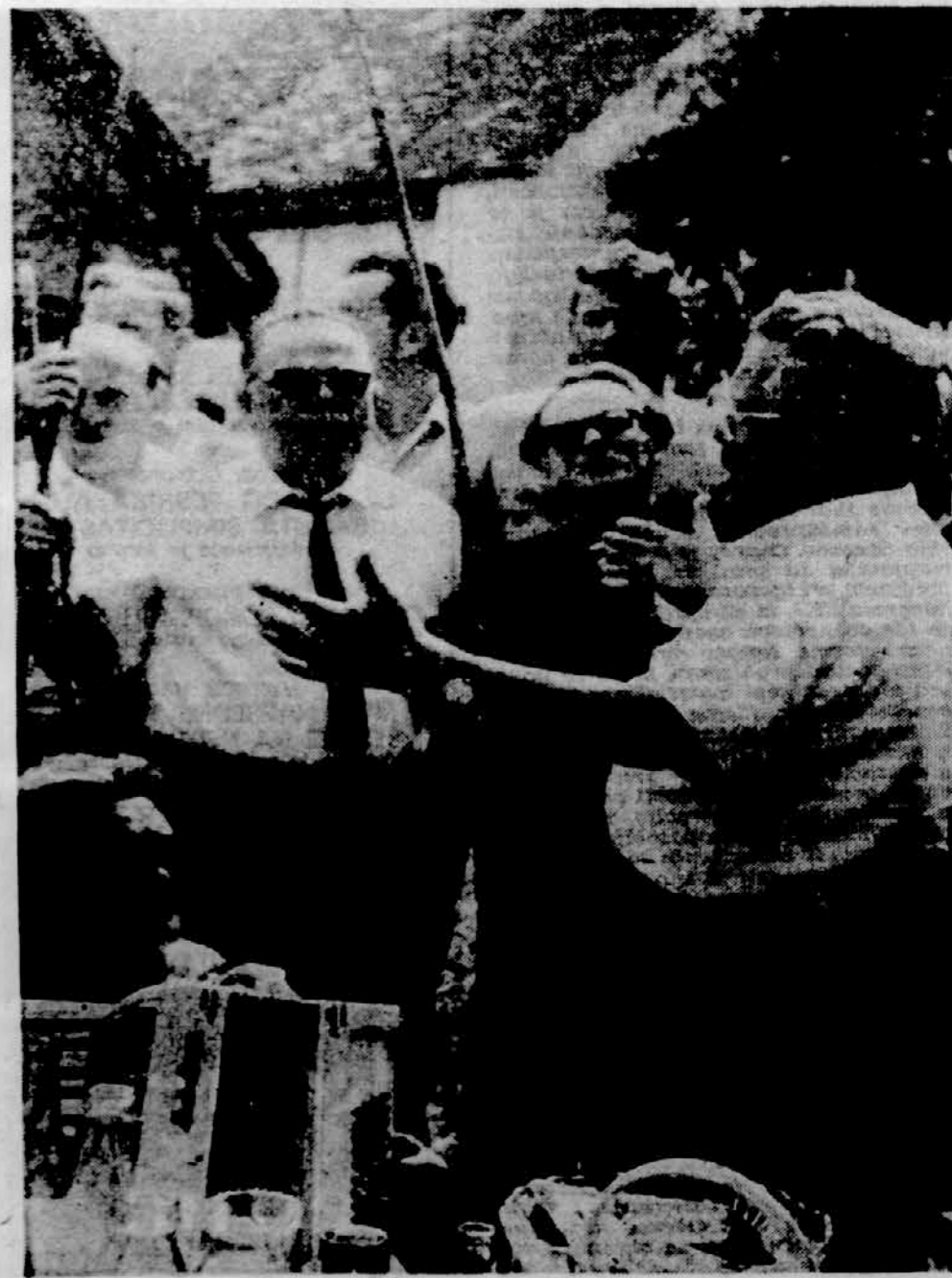
PEVOVODJA NA PIKNIKU PARTIZANSKEGA INVALIDSKEGA PEVSKEGA ZBOAR

Ko je naša državna delegacija obiskala Švedsko, je med bivanjem v tej deželi imel Edvard Kardelj vsepovsodno zdravico. Ko so odhajali domov, pa se je na letališču pohvalil Vladimiru Bakariću: «Ves čas sem se zaradi tebe trudil, da bi bil pri zdravcih originalen, da bi bila vsaka drugačna.» «Tako?», se je začudil Bakarić, »pa nisem nič opazil...«