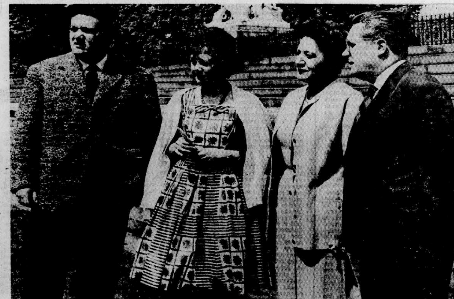
V KROGU DRUŽINE