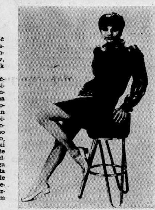
PO MATERINIH STOPINJAH