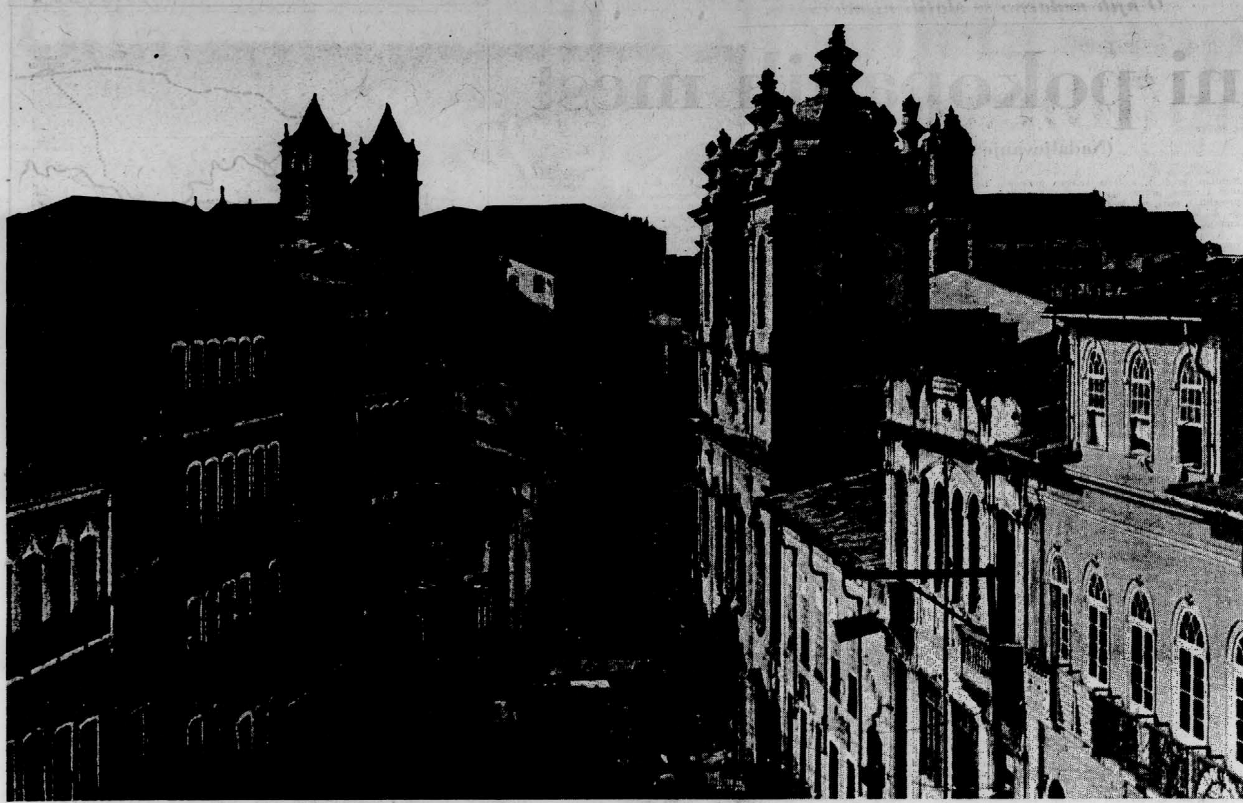
SAN SALVADOR BAHIA Nekdanja brazilska prestolnica