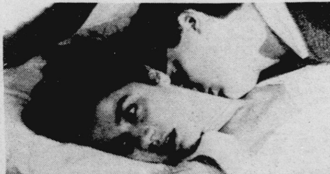
Prizor iz Vraga v telesu

Film je režiral Roger Corman. Igrajo: Vincent Price, John Kerr, Barbara Steele in drugi.