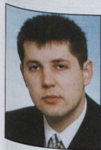
Piše: Igor Pišek, dipl. iur.