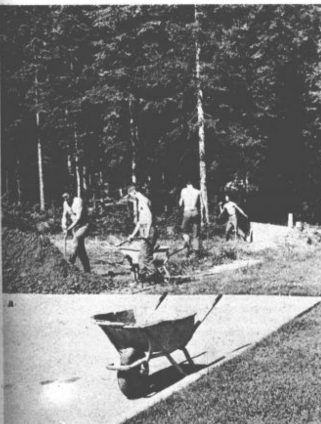
Letošnji dan grančarjev bo za vojake v obsejni postojanki »Savinjski partizan« v Logarski dolini še posebej slovesen. V petek, 15. avgusta, bo namreč na tem mestu osrednja proslava obsejnih enot ljubljanskega smadnega področja. S tem bodo čuvarji naših meja v Logarski dolini kronali svoje izredne uspehe, ki so jih dosegali v zadnjih letih. Med nje sodi med drugim tudi čudovito urejena postojanka in njena okolica, katere manjši del bodo do slavnja še uredili.