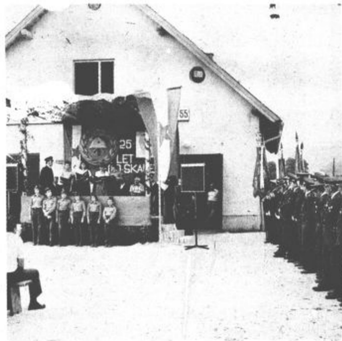
S proslave ob 25-letnici gasilstva v Skalah