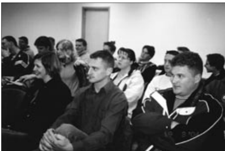
Občni zbor je bil v novih prostorih športnega društva.

Izboljšalo se je sodelovanje s šolo. Poleg akcije Veter v laseh - s športom proti drogi, v kateri sodeluje predvsem šolska mladina, so začeli z vadbo nogometa za najmlaj-