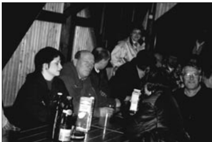
Udeležba na občnem zboru je bila velika, tako kot vedno.

nem izletu. Za boljšo prepoznavnost strežnega osebja na prireditvah so nabavili nove predpasnike. Ohranili so tesne stike s člani TD iz Tunjic. Novost, ki jo je prek društva organizirala kulturna sekcija, je bila odmevna in uspela slikarska kolonija.