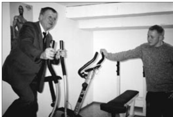
Po simboličnem odprtju župan preizkuša naprave za fitnes.

še dečke od 5 do 10 let, kar je bilo posebno pri starih lepo sprejeto.