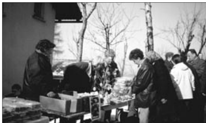
Ena od stojnic z okusnimi domačimi dobrotami.