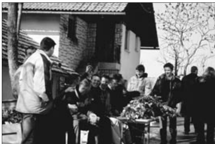
Ponudba velikonočnih butaric. Prodajalci so bili fantje iz Zdenske vasi.

Tiha nedelja je privabila k sv. Antonu veliko število ljudi, ki so se po maši v tamkajšnji cerkvi v lepem in toplem vremenu sprehodili ob stojnicah DPŽ Dobropolje - Struge, si ogledali lepe izdelke in tudi kaj kupili.