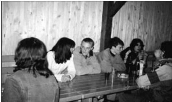
Omizje najmlajših članov

27. marca so se v koči Pri koritu zbrali člani TD Podgora na rednem letnem občnem zboru. Leto 2003 je bilo zanje uspešno, saj so organizirali vse tradicionalne prireditve, dejavni pa so bili tudi pri izgradnji sanitarno-skladiščnih prostorov.