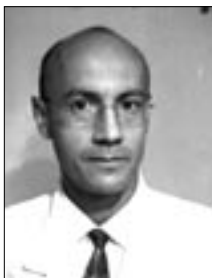
Piše: Zdravko Marič, dr.med.