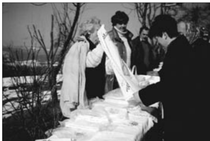
Bogata ponudba prtov članic DPŽ iz Strug