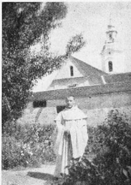
Na samostanskem vrtu.

»Seveda, saj so vprav trije bratje vitezi, grofje v Višnji gori, ustanovili stiški samostan. Veš, takrat doli v stiški dolini še ni bilo takih lepih cestâ, polj in hiš, goščava se je bohotila. Pa so prišli menihi,