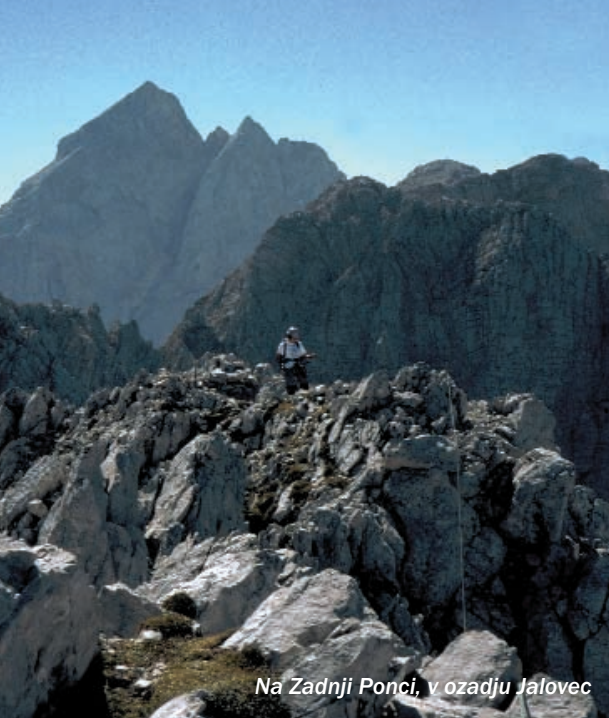
Na Zadnji Ponci, v ozadju Jalovec