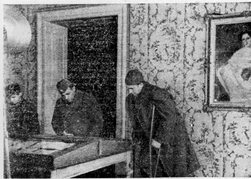
Ljudi partizan-invalid je prišel na Prešernovo razstavo v Mestni muzej