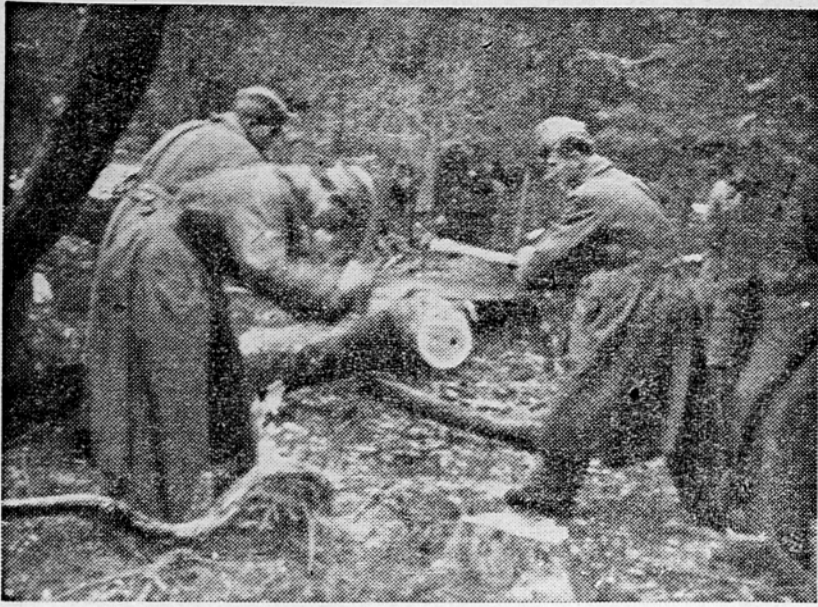
Naši borci pripravljajo les za obnovu porušenihi vasi

Po izvršeni častni nalogi osvoboditve se je naša ljudska vojska z vsemi svojimi silami in napori posvetila obnovi in izgradnji porušene domovine. Se v času težkih krvavih bojev s fašističnimi okupatorji so njene enote in boji pomagali ljudstvu zmerom in ob vsaki priložnosti. Zdati v dobi miru skuša naša vojska poleg svoje glavne naloge — naloge lastne graditve in krepitve — z velikimi napori pomagati ljudstvu, da bi se zacelile rane, ki mu jih je prizdejala vojna in dolgaletna okupacija. Ni ga skoraj tistišča v narodnem gospodarstvu, na katerem ne bi enote in borci naše vojske z vsemi močmi prispevali na pomoč ljudstvu in ljudskim oblastem in to z materinskimi sredstvi in z delovno silo. Pri tej pomoči sodeluje vojska zlasti pri gradnji porušenihi in požganihi vasi in oaravli, pri popravilu cest in železnihih prog ter v graditvi mostov. Prav tako sodeluje vojska pri vseh delih na polju. V skupinah in posamično so naši borci pomagali pri obdelovanju zemlje, pomagali so na njihavihi siromašnih kmečkih družin, ki so ostale brez oročev in sejalcev. Prav tako je pomagala naša Armada siromašnemu ljudstvu z življenjskimi potrebščinami in s prispevki iz denarju. Vsa ta uspešna in raznolika pomoč, ki jo je naša ljudska vojska pospevala ljudstvu, je bila izraz in dokaz velike ljubezni naše vojske do domovine, ljubezni, ki jo sleherni borec izkazuje in jo do svojega naroda, do svojega ljudstva.