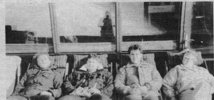
Če je že premalo snega za smučanje, je pač potrebno ujeti žarke sonca. Na terasi hotela na Golteh je bilo letos za to dovolj priložnosti.