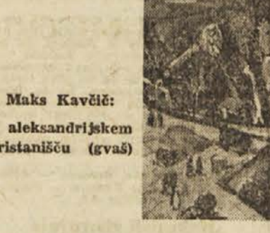
Maks Kavčič: V aleksandrijskem pristanišču (gvaš)

Zborovska zvočnost je šibka plat tega zboru. Zbor je tako rekoč brez tenorja, a basu manjka sočnosti. Ženski zbor je boljši. Pomanjkanje črstelega prirodnega zvočnega temelja pa zbor do neke mere kompenzira z znanjem, to je z dihalno in pevsko tehniko, ki se zdi, da je v tem zboru tako razvita, da glede tega prednjači med amaterskimi zbori. V interpretiranju tega sporednega zboru še ni dal zaokroženega rezultata: bobče lahko rečemo, da je