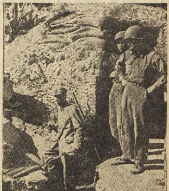
Na Taššanu so se kuomintangovci močno utrdili, kakor da bi name-ravali za vsako ceno braniti ta otok, ki je le nekaj kilometrov oddaljen od kitajske obale

Ko sem se vrnil iz Mandžurije, sem bil prepričan, da je Kuomintang napredal svojemu narodu na pol odkrito vojno. Neopredelne in krvavo je zahteval splošno ljudsko demonstracijo proti državljanski vojni, proti ameriški intervenciji in diktaturi. Na tisoče študentov, trgovcev in izobražencev so pretepili, na tisoče drugih zaprli ali pa postrleli in poklali z bajoneti na ulicah. Vse to so počeli večidel s prevezo, da se bore proti banditom, da love ošune in komunistične agente. Mnogo