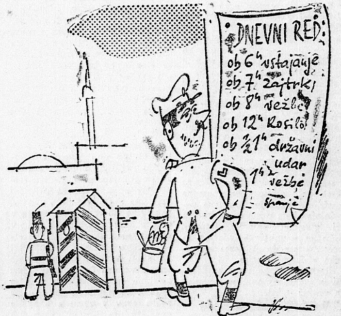
Karikatura: M. Bregar