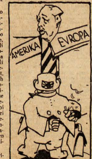
... in po njem