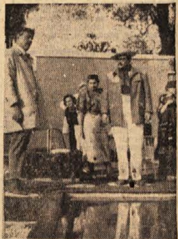
V francosko-italijanski koprodukciji in v režiji Jacquesa Tatija (na sliki v levem kotu), ki igra hkrati glavno vlogo, snemajo v Italiji film »Moj stric«.