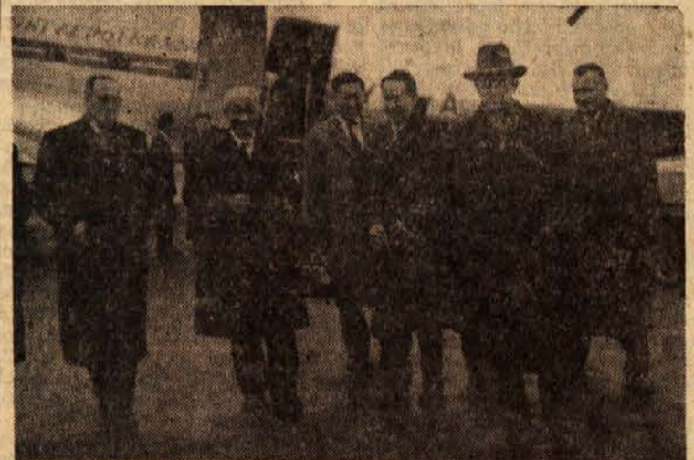
V Beogradu se že tretji dan mudi predstavnik japonske vlade Cudži Masanobu, ki je že navezal stike z našimi državnimi voditelji. Na sliki ob prihodu iz Egipta.

Omenjene proslave so se udeležili delegati iz 15 evropskih dežel, katerih državljani so bili zaprti v tem taborišču in so mnogi umrli v njegovih plinskih celicah. Taborišče je bilo največje morišče, kar so jih nacisti zgradili v drugi svetovni vojni. V njem so na vse mogoče načine pomorili štiri milijone internirancev. Taborišče so po vojni spremenili v muzej, ki pa še ni dokončno urejen. V njem bodo pozneje uredili in opremili mednarodno sobo, v kateri bodo zbrani predmeti in fotografije internirancev. Razen tega pa bo imela posebno sobo v