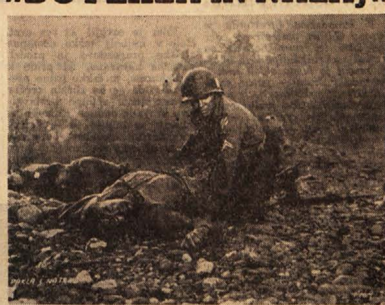
Predstave ob 15, 17, 19 in 21. - V glavni vlogi Audie Murphy. Prodaja vstopnic od 9.30 do 11 in od 14 dalje