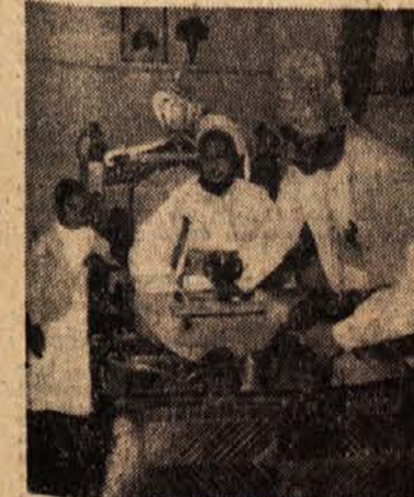
Imam Saif al Islam Ahmed, vladar Jemena, okrog katerega se zbirajo puštavski plemena na jugu Arabije

Taiz, 1. febr. (AP). — Imam Ahmed je skupini zahodnih novinarjev izjavil, da je Adenski protektorat, ki ga upravlja Velika Britanija, del jemenskega ozemlja in da se Jemen, če ne bo moč tega vprašanja urediti z Veliko Britanijo, obrnil na OZN.