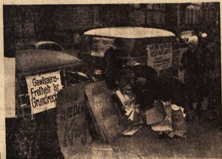
Kampanja proti obojevojni, obvezni vojaški službi in vojni se v vsej Nemčiji intenzivno nadaljuje. Na sliki priprava na tako propagandno akcijo v Frankfurtu

običajno, marveč demokršćanski izvedenec za zunanjo politiko Kilsinger. Obravnaval je v vladni