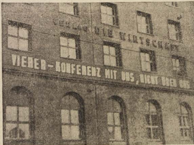
Z gesli opremljena hiša v vzhodnem Berlinu

Poročilo dalje pravi, da je »3/4 pismem za Dullesa in samo 1/6 za Molotova«.