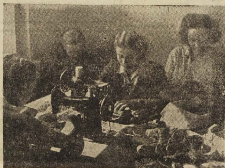
V Invalidskem domu v Kamniku se mladi ljudje uče raznih obrti ter se tako usposabljaajo za življenje