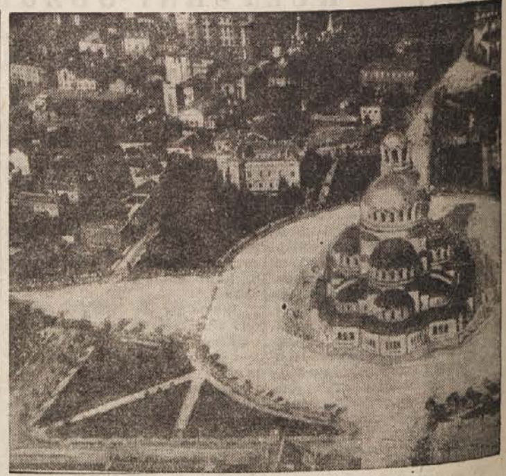
Pogled na Sofijo

Indijska javnost mnogo razpravlja o poročilu o popisu prebivalstva. Nekateri mu pravijo »drama v številkah« in trdijo, da se bliža Indija zelo hudim časom. Večina pa se zanaša na boga razdejanja Šivo, na boga ohranitve Višno in na ravnotežje v vesolju. »Naša žilavost in naše veselje do življenja,« je dejal neki Indijec, »je dar bogov. Bogovi pa bodo že našli za svoje probleme rešitev, tudi če svojih skrivnosti niso pravčasno sporočili statistikom, ki nam govorijo o čudežu ali katastrofi.«