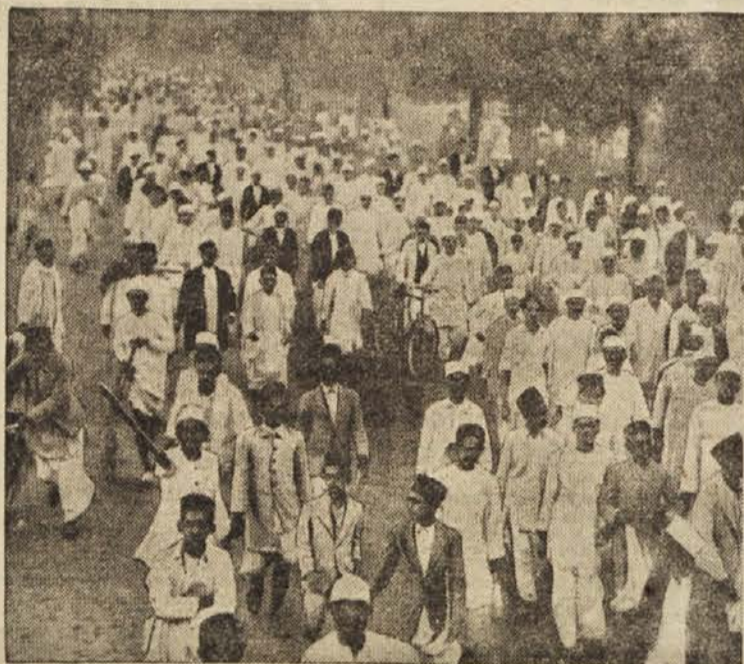
Gandhi je v pasivnem odporu proti angleškemu gospostvu nad Indijo prirejal množično romanje k morju po sol. Takšnih pohodov se je vsaki udeležilo nad 100.000 njegovih pristašev

Hall Vsak človek je sin lastnih dejanj. Cervantes