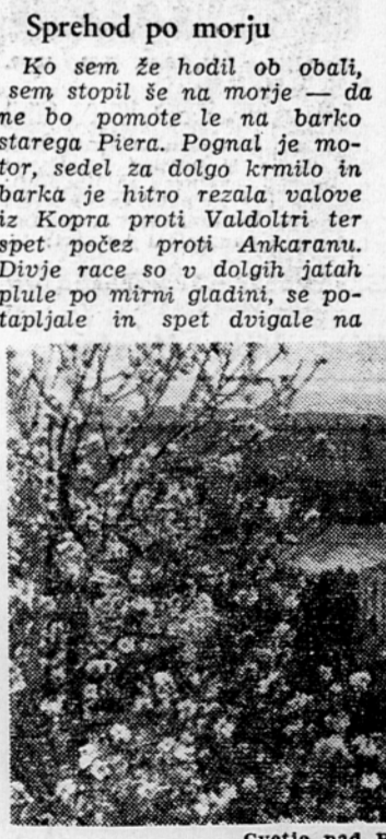
Cvetje nad Portorožem

Sprehod po morju Ko sem že hodil ob obali, sem stopil še na morje — da ne bo pomote le na barko starega Piera. Pognal je motor, sedel za dolgo krmilo in barka je hitro rezala valove iz Kopra proti Valdoltri ter spet počez proti Ankaranu. Divje race so v dolgih jatah plule po mirni gladini, se postopajale in spet dvigale na