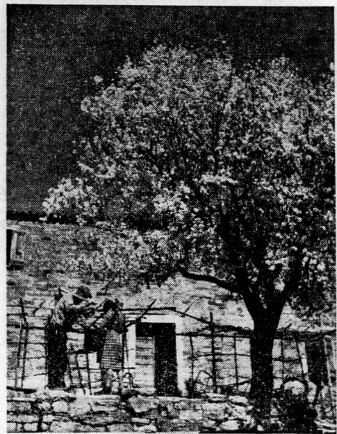
»Prišla je pomla«

S tem je prišel gospodarski odbor pri svoji razpravi do četrtega dela (prvi del daje pregled razvoja gospodarstva Ljudske republike Slovenije v letu 1953, drugi smernice za razvoj