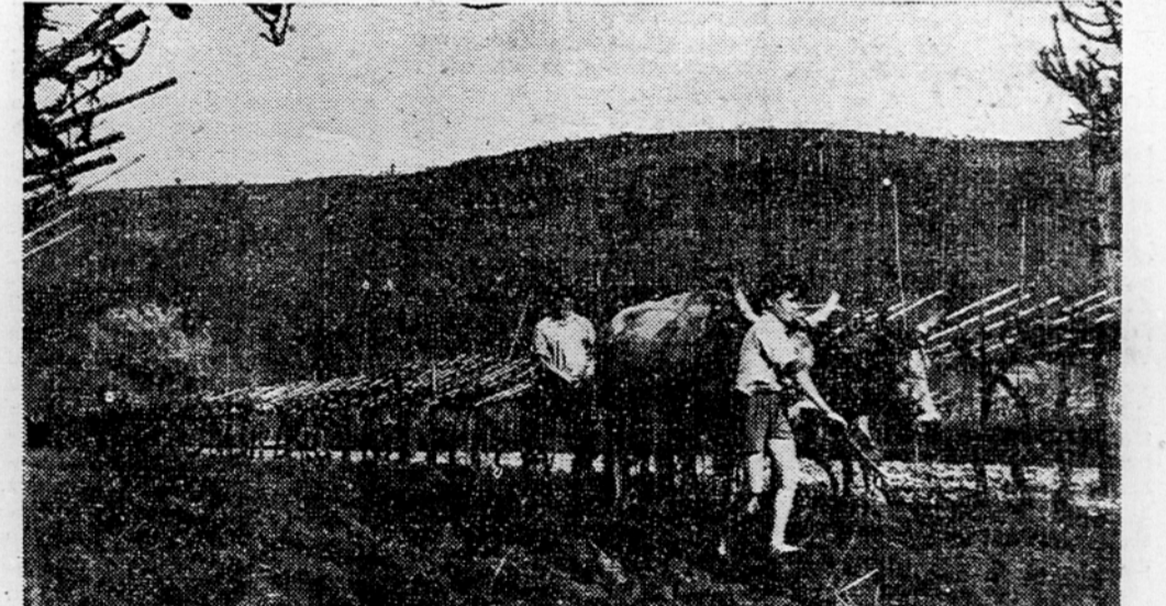
Spomlad na polju