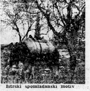
Istrski spomladanski motiv

mandeljnov cvet, breskve, marelice in češnje, ki že tudi odpirajo cvetove pričrpujejo, da je tu že nastopila pomlad prej kot v koledarju. V Izoli, mestecu, ki slovi po ribjih konzervah, številnih ribičih in najlepših dekletih v Istri, sem nameraval spomlad ujeti skozi lečo fotografskega aparata. Toda, cvetje brez sonca in povrh še temni oblaki, ki so se nizko zgrinjali nad cvetočo deželjo, so mi dali kaj malo upanja v uspeh. Toda, na sonce nisem utegnil čakati. Na njivi, pod cvetočimi drevesi sem našel nekaj postavnih rdečeličnih istrskih deklet ki so sadila krompir. Toda ko sem pripravil svoj