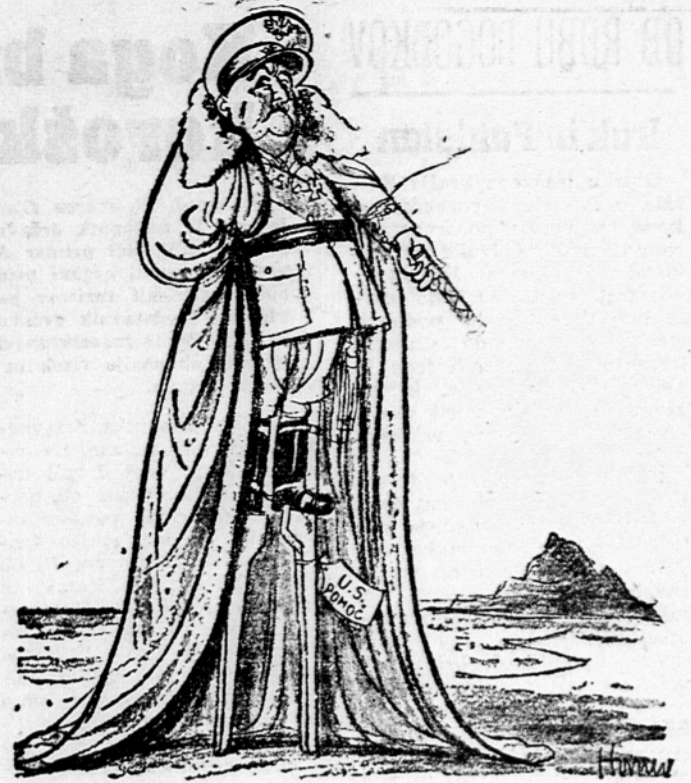
MODA: »Vellična«. Karikatura: News Chronicle

Francoski delavci zaenkrat zanimajo bolj