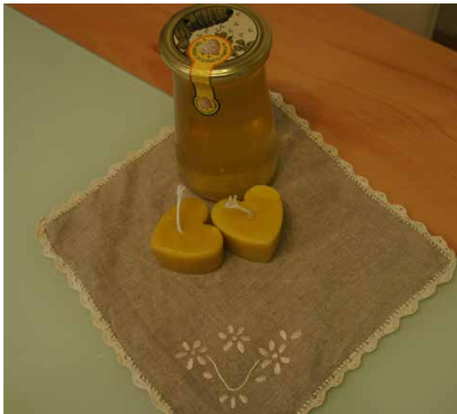
Slika 4: Končni izdelek in nagrada za udeležence kviza