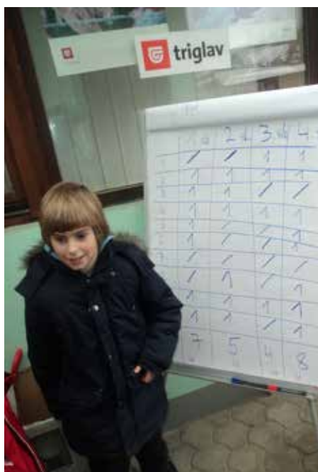
Slika 3: Sodelovanje učencev OŠ Poljčane na kvizu o poznavanju čebelarjenja in čebeljih izdelkov (foto: Klementina Godec, 8.2.2014)

V praktičnem delu delavnice so učenci OŠ Poljčane izdelovali sveče iz čebeljega voska. Predstavniki Čebelarkega društva jih je seznanil s postopkom vlijanja sveč ter jim predstavil uporabnost čebeljega voska tudi v drugih panogah, kot npr. kozmetiki, medicini in farmaciji. Po končanem vlijanju je sledil kviz na tematiko čebelarjenja in čebeljih izdelkov, kjer so učenci preverili svoje usvojeno znanje. Razdelili so se v štiri skupine in pod budnim očesom strokovne žirije odgovarjali na deset vprašanj, povezanih s čebelami in njihovimi izdelki. Na koncu kviza je sledila razglasitev najboljših skupin in nagrada v obliki kozarca medu za vsakega udeleženca kviza. Odziv s strani učencev je bil zelo pozitiven in izkazalo se je, da so medene nagrade predstavljale odlično motivacijo za sodelovanje.