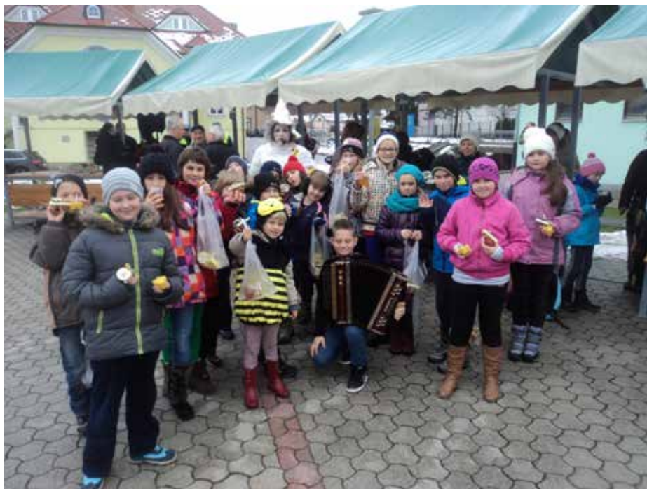
Slika 1: Udeleženci dogodka iz OŠ Poljčane z maskoto Vilo zime (foto: Klementina Godec, 8.2.2014)