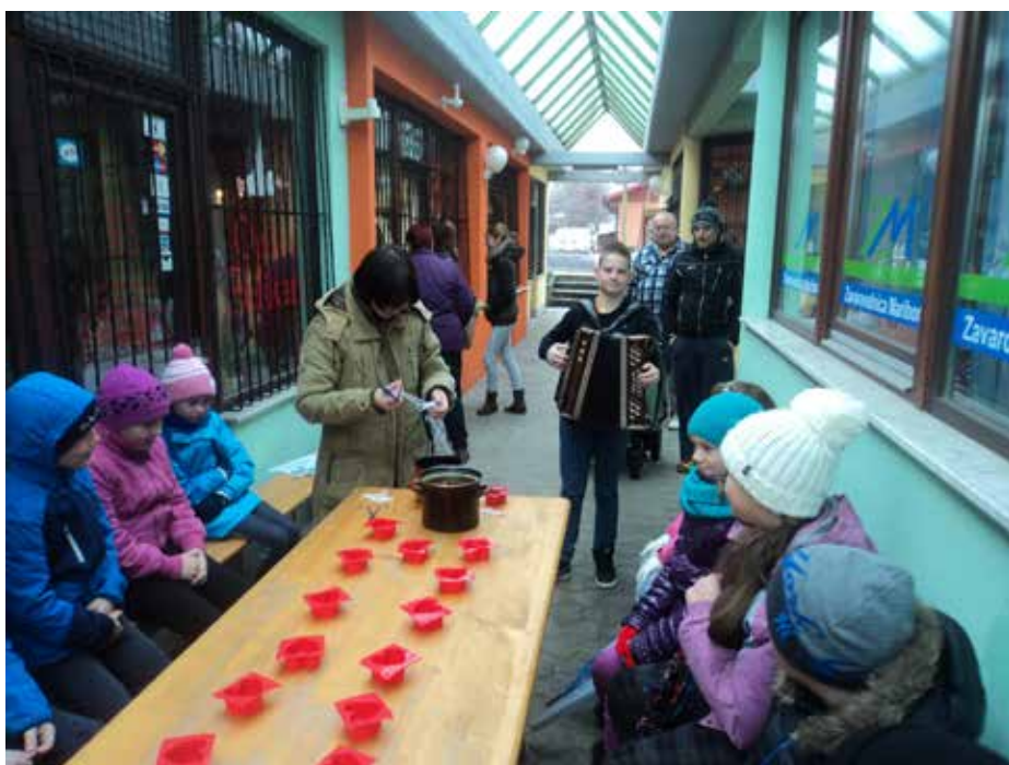
Slika 2: Praktična delavnica vlijanja sveč iz čebeljega voska (foto: Klementina Godec, 8.2.2014)

lokalno okolje in 2) ustrezno ozavestiti ter izobraziti lokalno prebivalstvo o pomenu samooskrbe z velikim poudarkom na mladi generaciji.