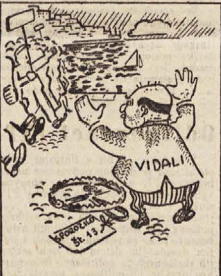
SLIKA IZ TRSTA

če pa teh poviškov ne bodo dobili, bodo morali denar vrniti. Poleg tega je vojaška uprava predlagala, da dajo delavcem predujem za 6 dni plačanih počitnic. Ker bi vse to značilo manj kot omih borih 56 lir na dan, so seveda morali sindikalni zastopniki to ponudbo odkloniti. Stavkajoči vztrajajo na tem, da morajo veliki industrijci skleniti sporazum na štiri osnovi, kakor so ga že sklenili mali industrijci, to je za 5 lir smešno nizkega poviška draginske doklade. Obe vodstvi sindikalnih organizacij, ki sta se eestali danes popoldne, sta sklenili, da splošna stavka, ki je pričela večerjavni popolno, preneha danes popolno, nadaljuje pa se stavka industrijskih delavcev tako, kot pred razglasitvijo splošne stavke.