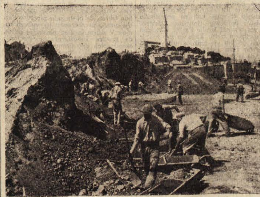
Istrski boksit. V Rovinju ga nakladajo na ladje in odvažajo v tovarne aluminija

Maršal Tito se je danes razgovarjal s člani delegacije, zanimal se je za delo kongresa in prizadevanje naših skladateljev, da s glasbenimi deli prikažejo življenje in stremeljenja narodov nove Jugoslavije.