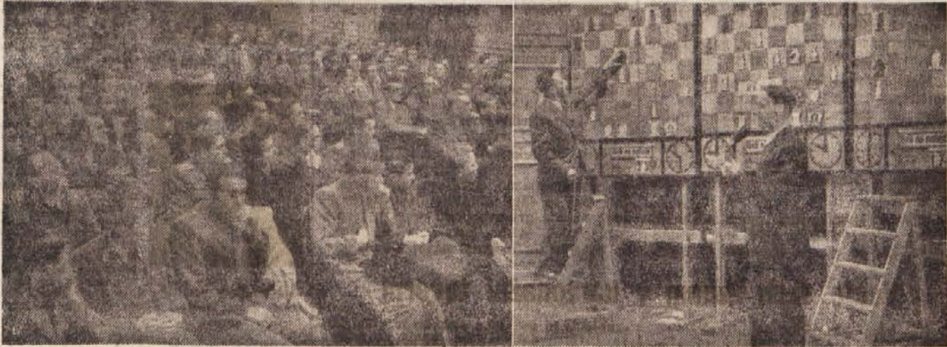
Veliko dvorano Filharmonije v Ljubljani, kjer so naši šahovski mojstri na demonstracijskih deskah prikazovali potek partij, je vsak večer obiskalo nad tisoč ljubiteljev šaha

hovski izurjenosti. Zadnji del brzojavke je bil naslovljen na ing. Vidmarja ml. Radiotelegrafska služba šahovskega radijskega prenosa v Beogradu je prejela brzojavko od šefa iste službe v New Yorku: »Zelo sem vesel, da lahko pošljem vašemu kolektivu iskrene čestitke in zahvalo za čudovit uspeh prenosa šahovskega matcha.« Američani so takoj po končanih par-