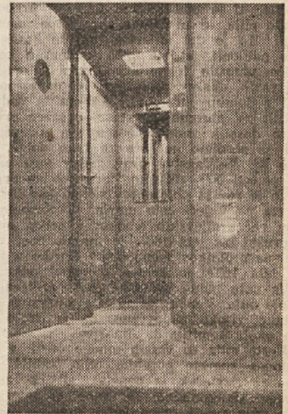
Pogled v kabino osebnega dvigala v palači Vzajemne zavarovalnice v Ljubljani. (Napravo izvršila tv. Wertheim.)

Jos. Dom. Mantuani Ljubljana — Tyrševa c. 17